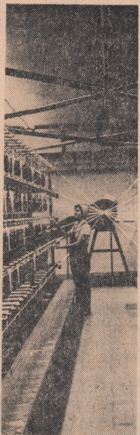
Aspect cotidian de muncă la Uzina de fibre și fibre sintetice - Săvinești

Primat adeziunea la proiectul de statut al Casei de pensii. În adunările generale au fost aleși delegații la Congresul de constituire a Uniunii Naționale și la conferințele de înființare a uniunilor raionale și orașenești. Astăzi, încep conferințele pentru înființarea uniunilor raionale și orașenești ale cooperativelor agricole, etapă nouă în pregătirea Congresului de constituire a Uniunii Naționale a Cooperativelor Agricole, de analizare și rezolvare a unor probleme privind îmbunătățirea activității cooperative.