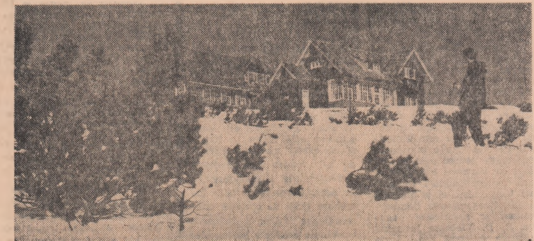
Jnepeni, zăpadă imaculată și... eabana „Piatra Arsă”

Televiziune MIERCURI 9 IANUARIE 19.00 — Telemurul de seară. 19.15 — Pentru școlari: Știința și soțietăți? 19.30 — Seară de teatru: NORA de H. Ibsen. Interpretează colectivul Teatrului Național „L. L. Caragiale” din București. În pauze: Șah și Poșta televizată. 20.30 — Cîntec „Momente din istoria cinematografului. Începuturile filmului românesc. 23.15 — Telemurul de noapte, buletinul meteorologic.