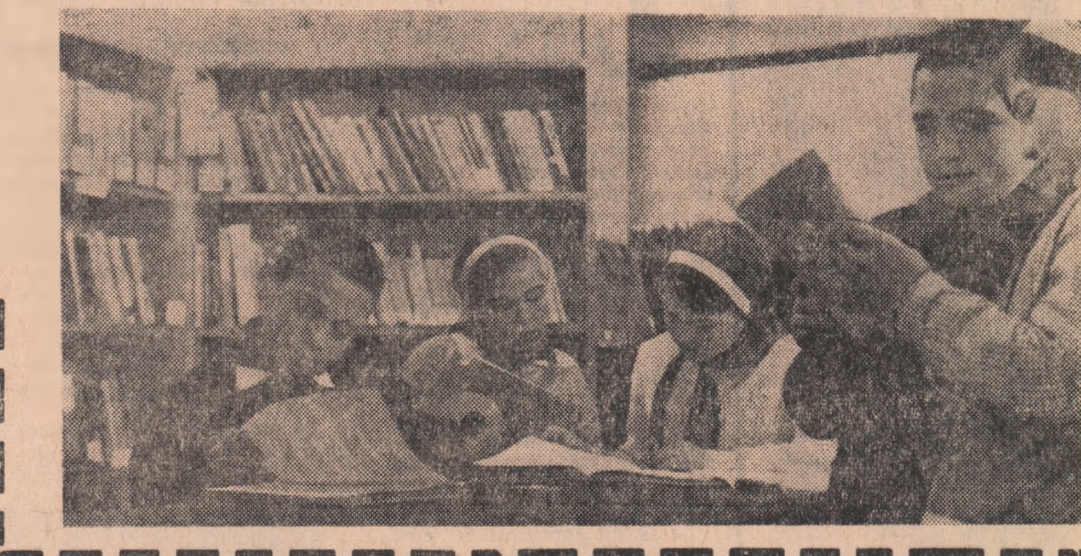
„Luna cărții la sale”. Mici cititori din com. Popești - Leordeni, regiunea București, în biblioteca sa-teasca

La auzul acestor cuvinte, se povestește că sultanul ar fi exclamat că o țară în care viețuiește un astfel de popor nu crede că va putea fi vreo dată biruită și transformată în pașalic. Și, copleșit de uimire și admirație, a săvîrșit un gest pe care nu-l mai făcuse niciodată: l-a dăruit tînarului libertatea.