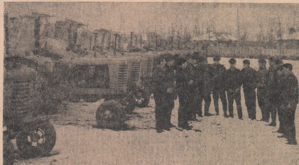
Mecanizatorii de la S.M.T., Radomirești, regiunea Argeș, au executat reparațiile mașinilor agricole și tractoarelor în proporție de 94 la sută. În fotografie: Un grup de mecanizatori într-un moment de răgaz