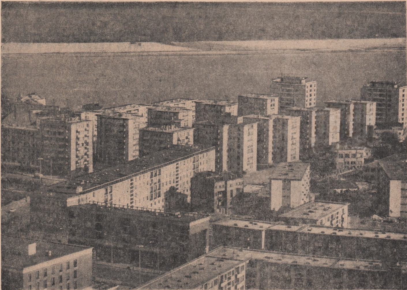
GATAȚI: detaliu din centrul orașului

Chipul țării se împodobește mereu cu noi și impresionante realizări Cum îi ajutăm pe elevi să le cunoască?