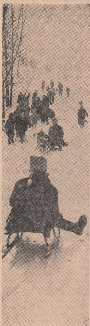
Toată lumea la săniuș

Anchetă realizată de I. RUS (Continuare în pag. a III-a)