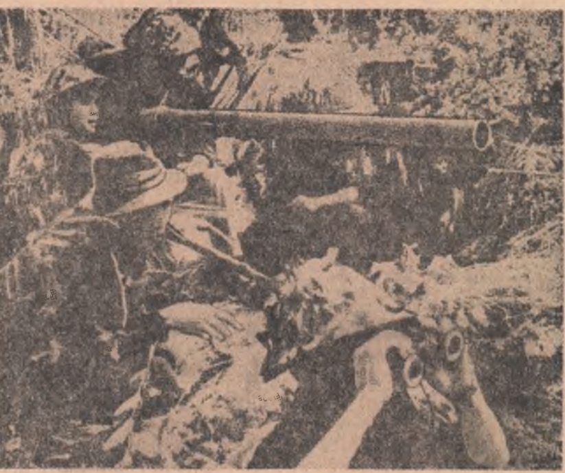
Unitate de artilerie a forțelor patriotice din Vietnamul de sud

I. MĂRGINEANU corespondentul Agerpres la Roma