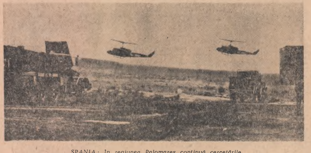
SPANIA: În regiunea Palomares continuă cercetările