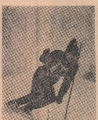
În plin efort în dificila probă alpină