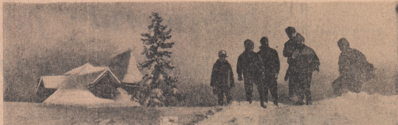
În excursie, la cabana Susai