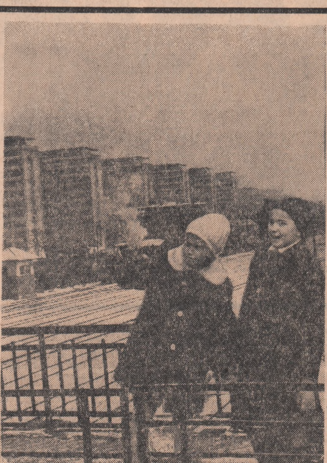
„Acolo este casa noastră!” — Vedere de pe Podul Grant