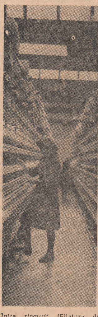
„Între ringuri” (Filatura de lînă pieptănată — București)