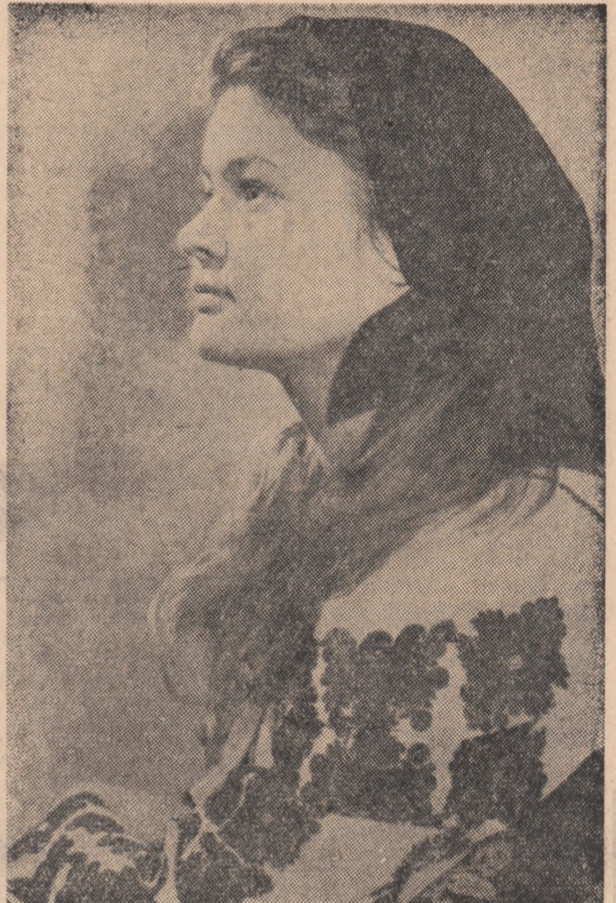
Frumusețe din Țara Moților

de ION BĂIEȘU Curajul este acea înșușire omenescă de a desăvîrșiță no- blețe, care produce asupra oamenilor cea mai puternică și tulburătoare impresie, poate cea mai respec- tată și la hidrocentrale energetice au fost realizate turbine cu abur începînd de la 1 pînă la 10 MW și hidroagre- gate de 4 pînă la 22,5 MW, iar în prezent sînt în curs de fa- bricatie turboagregate de 12 și 50 MW. Alimentarea acestora cu abur se face din cazanele, de asemenea în curs de fabri- cație, de 120 și 420 tone abur pe oră. În actualul cincinal, în afară de cele trei hidroagregate pen- tru șantierul de la Portile de Fier se vor asigura hidroagre- gate de 30, 125 sau 175 MW, pentru alte hidrocentrale ce se vor construi în țară. (Agerpres)