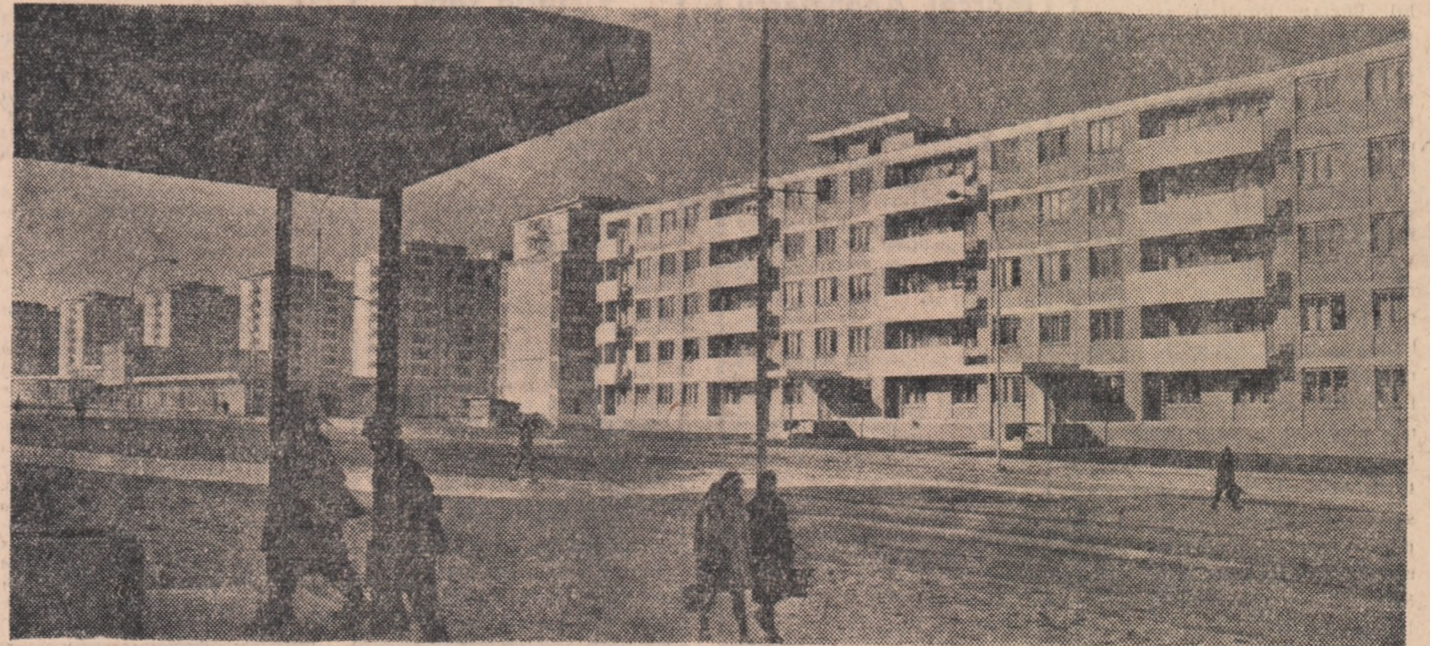
Zi de lucru în Orașul Gheorghe Gheorghiu-Dej