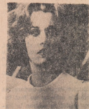
Jane Fonda în „Duminică la New-York”