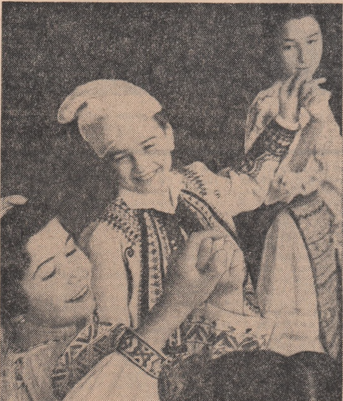
Așa-1 hora românească