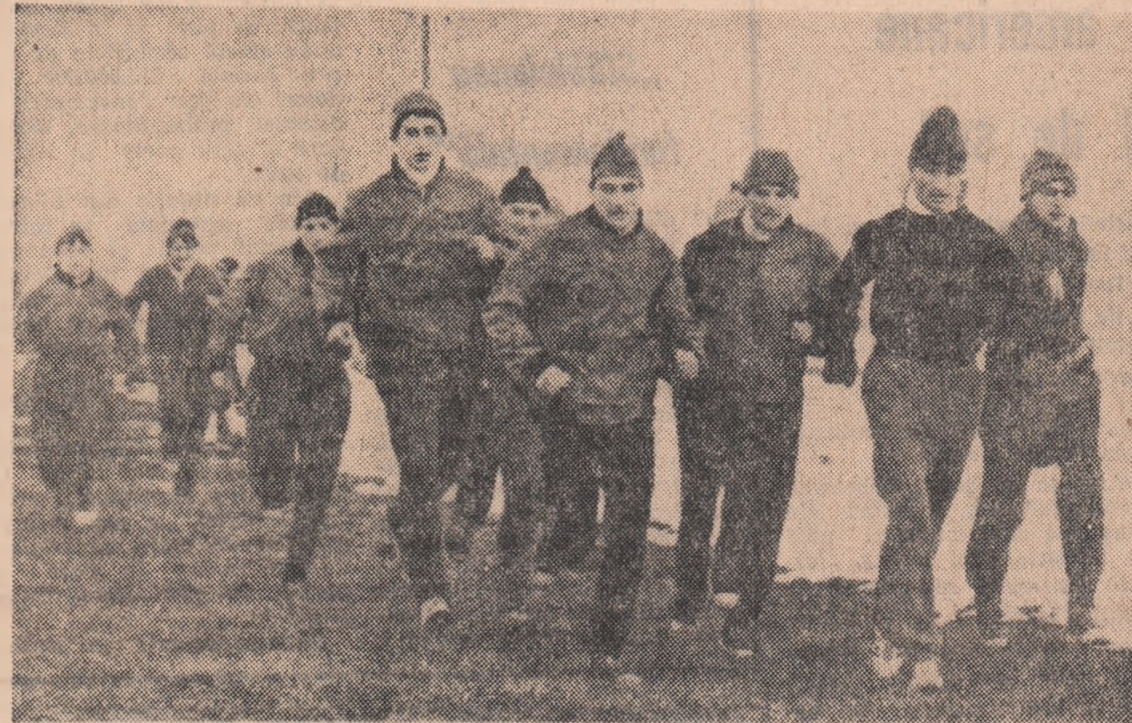
Crosiștii din lotul republican în timpul unui antrenament desășurat la Timișoara.