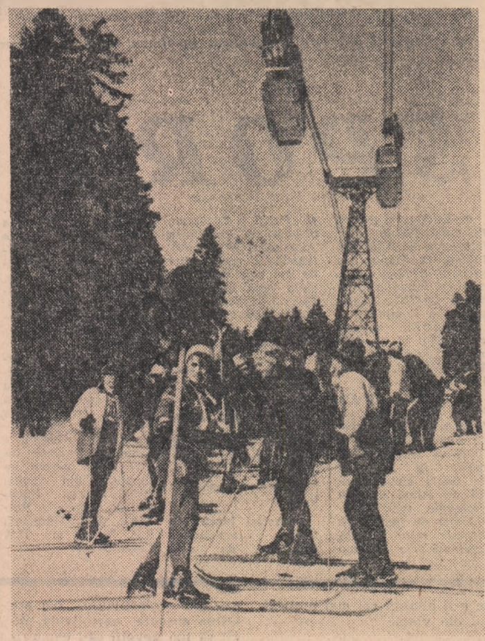
R. D. GERMANĂ: Tineri schiori pe piturile de la Oberwiesenthal

Presa din Cleveland publică cronici elogioase la adresa ansamblului „Ciocîrlia“. Frank Hruby își începe articolul din ziarul „Cleveland Press“ intitulat „Balețul folcloric românesc are vitalitate și frumusețe“, cu următoarele cuvinte: „Puneți la un loc vigoarea fantastică și frumusețea lirică și aveți oglinda ansamblului românesc“.