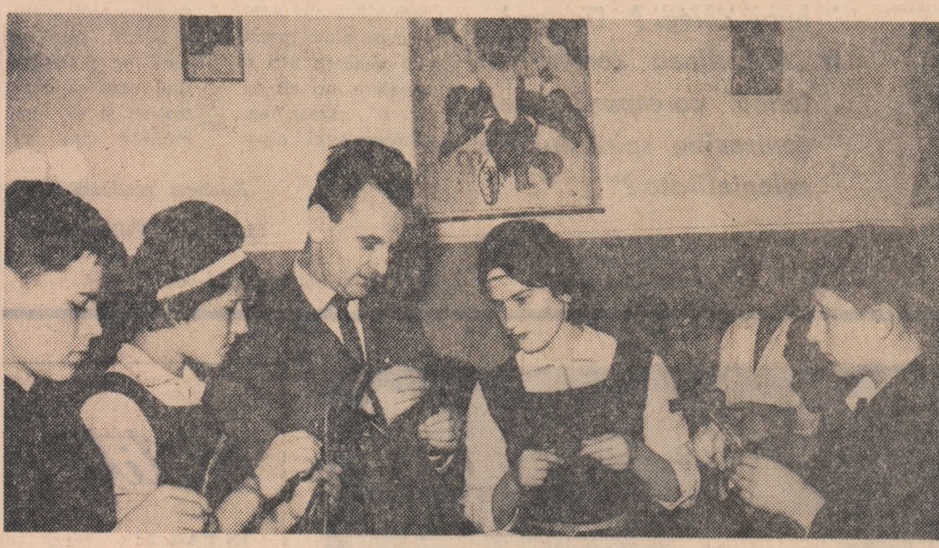
Oră de lucrări practice în laboratorul de fito tehnie al Centrului școlar agricol Fundulea.

Pe drumul comunal Copăceni — Poieni, raionul Teleajean, în dreptul kilometrului 6+150 — ne-a informat co-respuzentul nostru voluntar D. Păduraru — este un pod. Acesta este însă uzat. Fîind seama că pe acest drum circulă mașini de tonaj mare care aparțin schelei petroliere Boldești, pericolul de accidente crește pe măsură ce repararea podului este tărăgînată. Sesizînd acest fapt Sfatului popular raional Teleajean, ni s-a comunicat că într-adevăr podul de la km 6+150, de pe drumul comunal Copăceni — Poieni, are o stare de viabilitate „mediocră”. Secțiunea de drumuri și-a prevăzut ca în anul 1966 să repare și să îmbunătățească din punct de vedere constructiv acest pod, pentru ca el să poată suporta autovehicule de tonaj mare. Să sperăm că prevederea se referă la partea a anului 1966. Deocamdată însă „Atențiune, conducători-auto!”