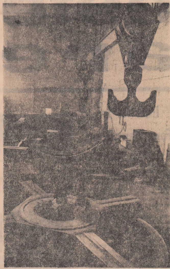
Hydrocentrala Bacău I. La cea de a II-a treaptă a cascadei de hidrocentrale de pe Bistrița sînt terminate construcțiile de beton ale uzinei și barajului. În prezent se execută montajul echipamentului hidroenergetic care va avea o putere instalată de 23 de megawați.