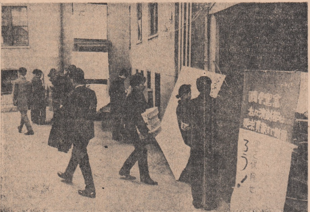
În Japonia se desfașoară o vastă acțiune a tineretului studios împotriva majorării taxelor în universități. Iată un aspect de la o asemenea manifestare: studenți alinați din panouri cu revendicările lor