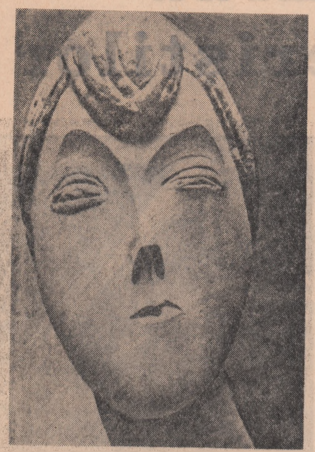
C. Brâncuși: Portret