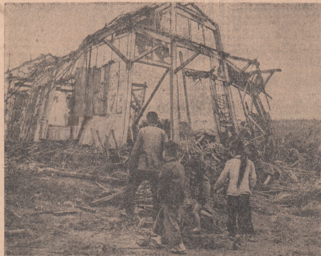
R. D. VIETNAM. — Rămășițele unei grădinițe de copii distrusă de raidurile bombardierelor americane

Agencia de presă „Eliberarea” a dat publicității un comunicat, potrivit căruia, în perioada 9 ianuarie — 9 februarie, 6438 soldați americani, sud-coreeni și australieni au fost uciși, răniți sau făcuți prizonieri de către forțele patriotice sud-vietnameze. Același comunicat menționează că 276 avioane au fost distruse și 87 de vehicule serios avariate.