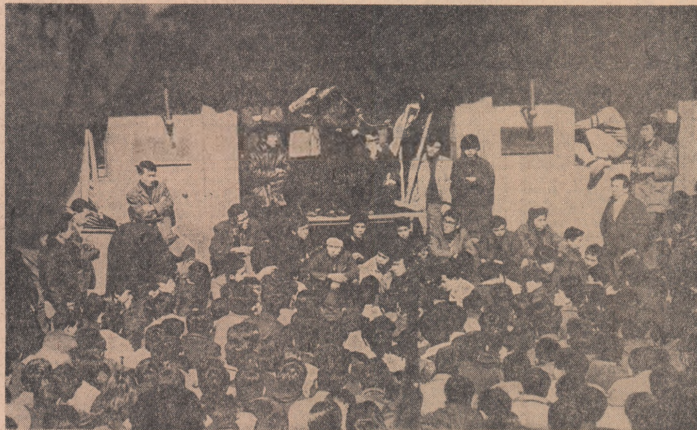
JAPONIA. — Studenții Universității Waseda din Tokio continuă greva împotriva scumpirii taxelor universitare