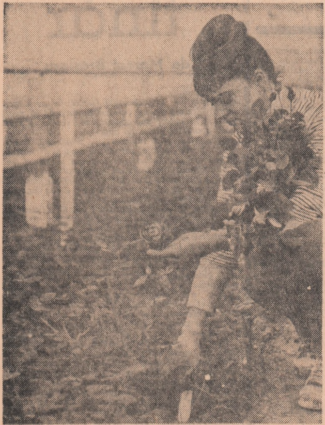
De serele din Popești-Leordeni se recoltează trandafirii

chardson o vastă incizie cinematografică în toate mediile sociale ale Angliei secolului al XVIII-lea, o evocare în tonuri caustice a întregii sale stratificări sociale. Nu cred că după vizionarea filmului mai poate rezista risului ucigător vreuna din instituțiile onorabile ale vremii. Moravurile deșuchate ale aristocrației, săfărîmăciile religiei și a familiei, cultul pentru proprietate, toate acestea sint spurcate magistral. Richardson ne dovedește încă o dată puterea. Filmul său are o construcție extrem de precisă. Evocarea unor vremuri mai îndepărtate prezentului filmului vezi pregenericii) o face în stilul filmelor mute (dar nu parodiind), fără dialog și folosind ierturile cu text. Richardson folosește posibilitățile vas-