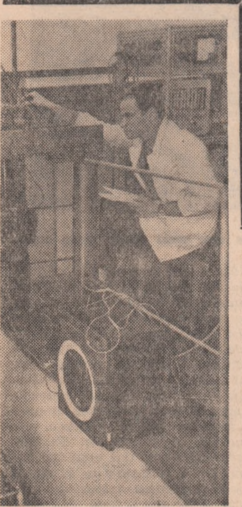
În laboratorul de încercat ma- șini hidraulice al Institutului politehnic din Timișoara

SĂMBĂȚĂ 26 FEBRUARIE 19,00 Telegiurnal de seară. 19,15 Pentru cei mici. 20,00 Telegiur-nal. 21,00 Film: Sîntul. 21,50 Aspecte de la campionatul mondial de patină artistică (dans — figuri libere). Transmisivune de la Davos (Elveția). 23,00 Telegiur-nal de noapte. Sport. Buletin meteorologic.