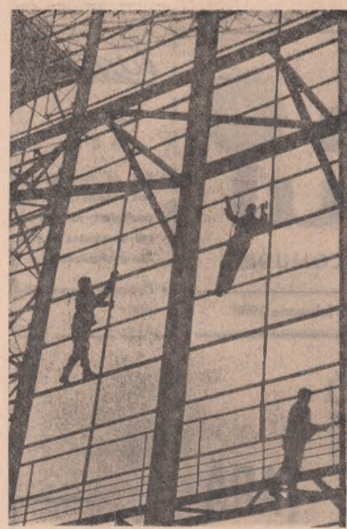
Pe schele. (Șantierul Uzinei metalurgice București).