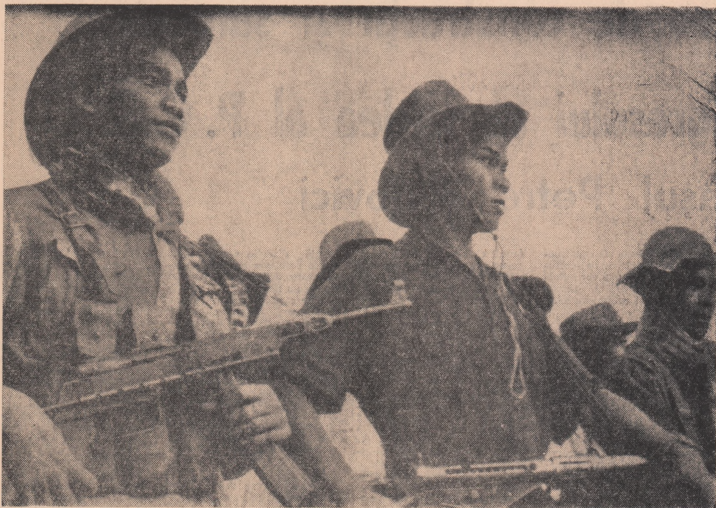
Tinerii aceștia sud-vietnamezi, luptători în forțele patriotice, sînt gata să se sacrifice pentru libertatea patriei lor

Newyorkezii au întâmpinat miercuri seara pe președintele Lyndon Johnson, cu o puternică demonstrație de protest împotriva agresiunii americane în Vietnam. Sosit în marea metropolă pentru a lua parte la festivitatea organizată de asociația „Casa Libertății”, în cursul căreia urma să-și fie înmănată o distincție, președintele a găsit, în dreptul baricadelor ridicale de poliție în fața clădirii marelui hotel „Waldorf Astoria” peste 7 000 de persoane purtînd pancarte pe care era scris: „Puneți capăt războiului din Vietnam!”, „Aduceți trupele acasă!”, „Ardeți ordinele de concentrare, nu copiii vietnamezi!”.