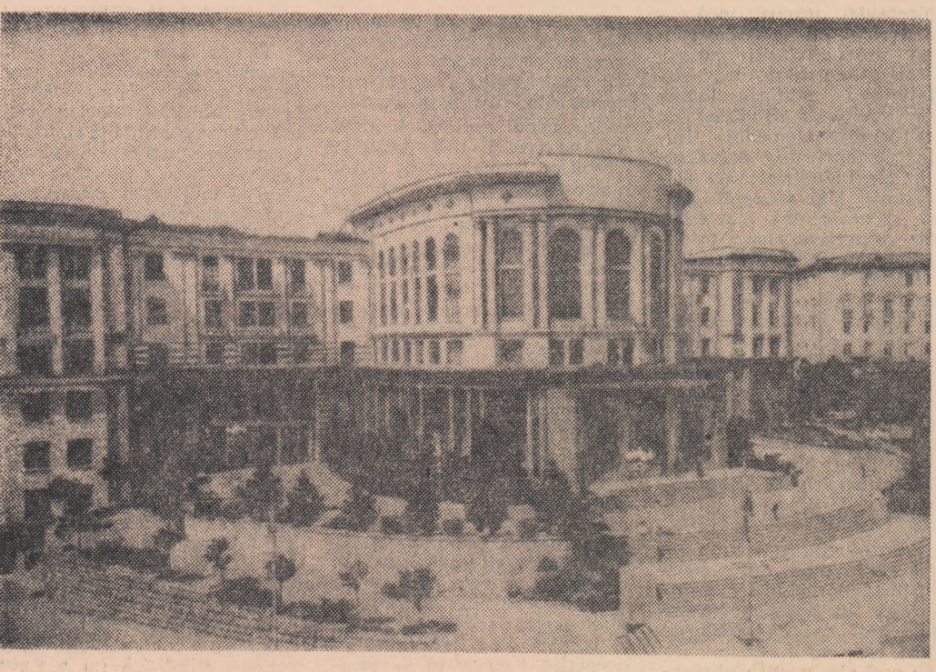
U.R.S.S.: Vedere a Institutului politehnic din Tbilisi