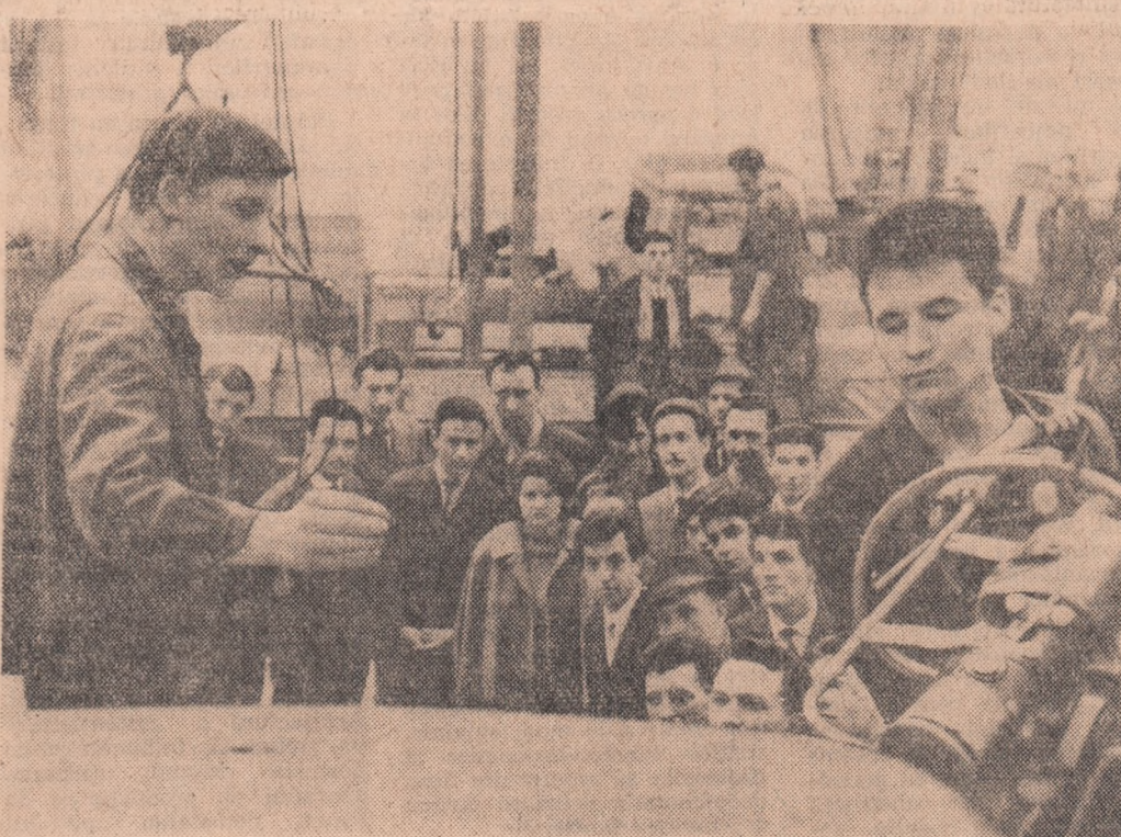
Mal mulți tineri de la Uzina „Autobuzul” din București au fost oaspeți, acum cîteva zile, ai colegilor lor de la Uzina „Steagul roșu” din Brașov. Între constructorii de autobuze și cei de autocamioane s-a realizat un util schimb de experiență.

Stațiile noastre de radio vor transmite astăzi în jurul orei 21.10 ultima parte a înființării internaționale de hochei pe gheață dintre selecționetele României și Finlandei. Transmisia se va face pe programul II.