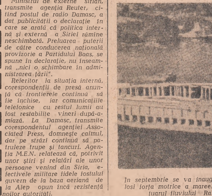
În septembrie se va inaugura în Franța o centrală electrică de un fel deosebit; ea va folosi forța motrică a marelor din. Marea Mineci. Un baraj lat de 370 m. zădărește estuarul fluviului Rance. Noua uzină va produce peste 600 milioane kWh

Agencia Reuter anunță că fostul șef al statului, Amin el-Hafez, fostul premier Salah Baidar și alți cinci membri ai comitetului interarabă a Partidului Baas se găsesc sub stare de arest, urmînd să fie judecați.