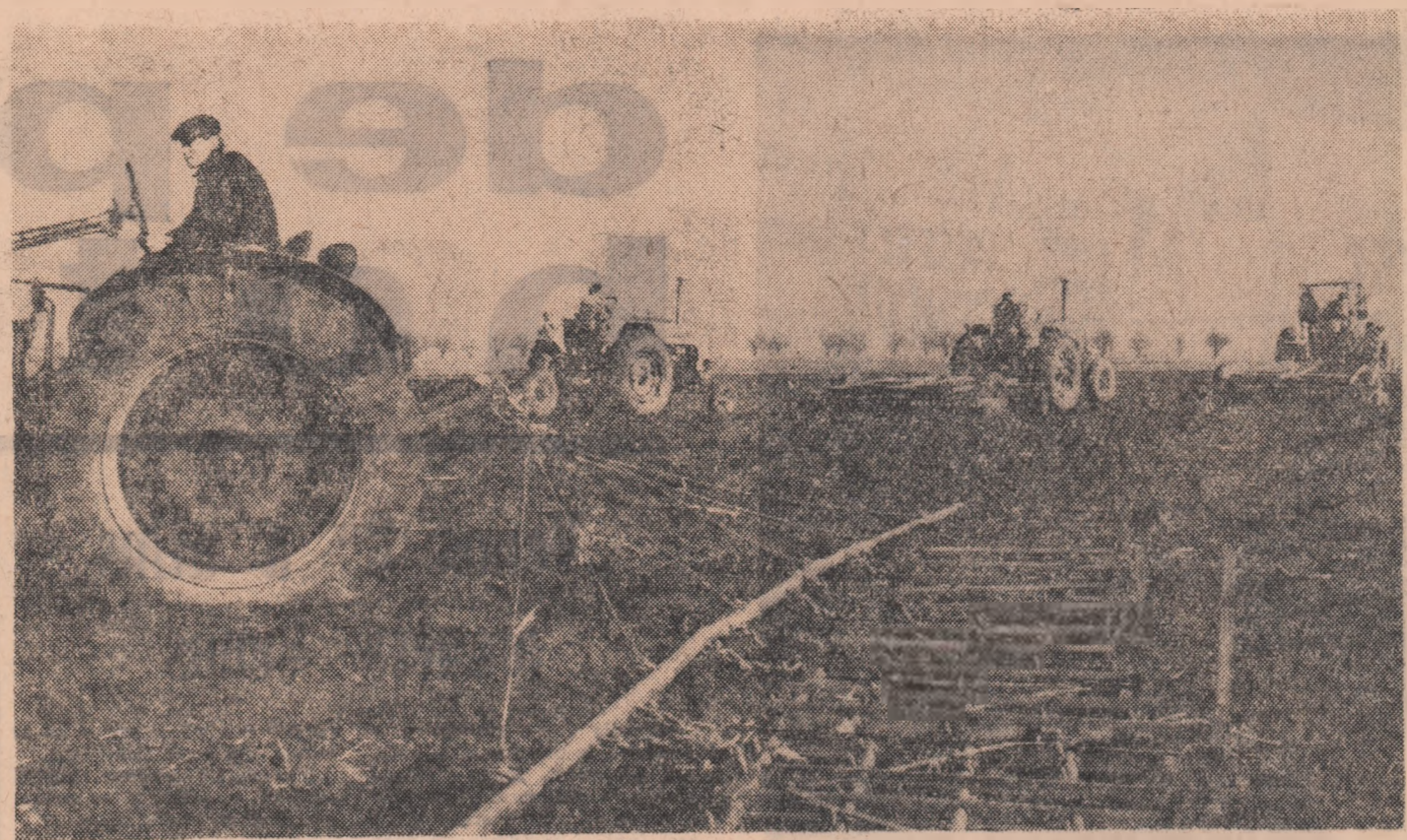
Pregetirea terenului în vederea însămînțării de primăvară la G.A.S. Popești-Leordeni București

LAL ROMULUS Într-o îngrijită prezentare grafică a apărut volumul Folclor poetic nou editat de Casa centrală a creației populare, editat alcătuit și îngrijit de Ion Meitoin. Grupul creației poetice populare culeasă din toate regiunile țării, volumul cuprinde o întinsă geografie lirică a folclorului românesc contemporan, izvoiri din sublimarea în metafora poeziei a bucuriilor și pasiunilor cotidiene. Producțiile, mai mult sau mai puțin anonime, aparute în numeroase culegeri și corolade de această substanțială grupare lirică oferă o imagine reală a continuii robuste și facultății creatoare a poporului nostru. Acceptînd existența continuității elaborării creației anonime nu putem trece cu vederea notele speciale pe care le imprimă schimbările structurale produse în conștiința estetică a creatorului popular, înfrînte