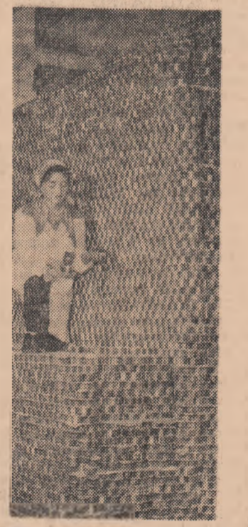
Arhitectură (Într-una din magazile Fabricii de conserve din Tecuci)