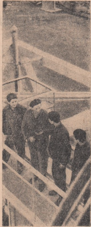
Elevi din anul III al Școlii profesionale de mecanici pompe compresoare din cadrul Grupului școlii chimice Craiova veniți în practică la Fabrica de acid azotic a Combinatului chimic Craiova primesc primele îndrumări.