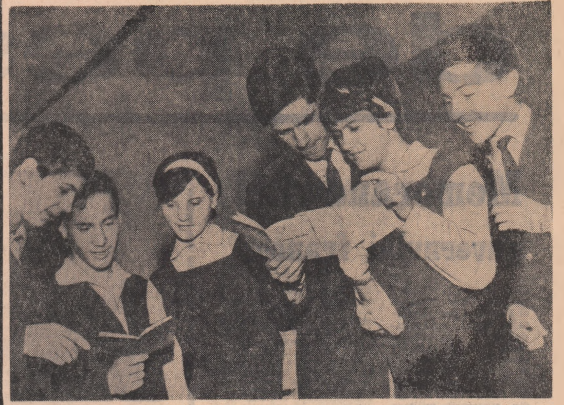
De ieri, după ultima oră de curs, elevii sînt în vacanță. Timp de două săptămîni, în aceste zile frumoase ale începutului de primăvară, elevii de toate vîrstele se vor recrea, își vor relansa forțele pentru următoarea etapă școlară.