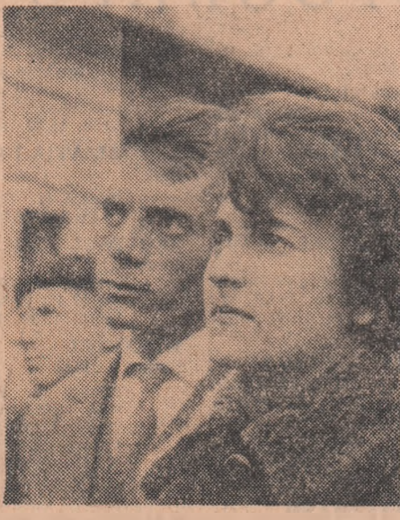
Din loc în loc vizitatorii se opresc și ascultă cu gravitate cuvintele ghizilor.