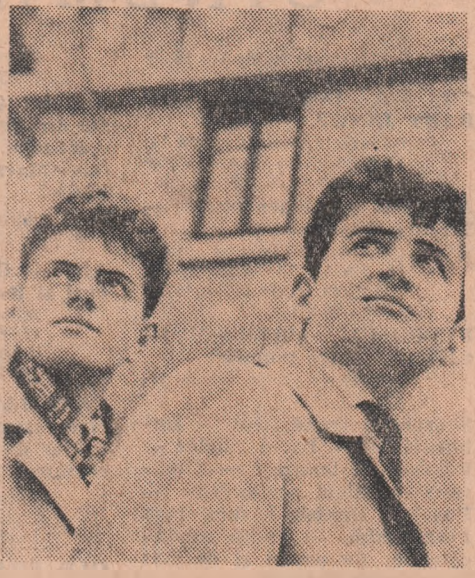
Tinerii păsesc cu emoție printre zidurile reci ale fostei închisori