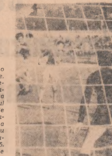
Metalgurștii bucureșteni salvează un gol din apropierea porții

În inchelare, menționăm buna pregătire și comportare a sportivilor în „Carpini-Sinaia” care au câștigat trei din cele patru titluri, reavînzându-se pentru înscusul de anul trecut cînd el n-au cucerit nici un titlu de campion al țării.