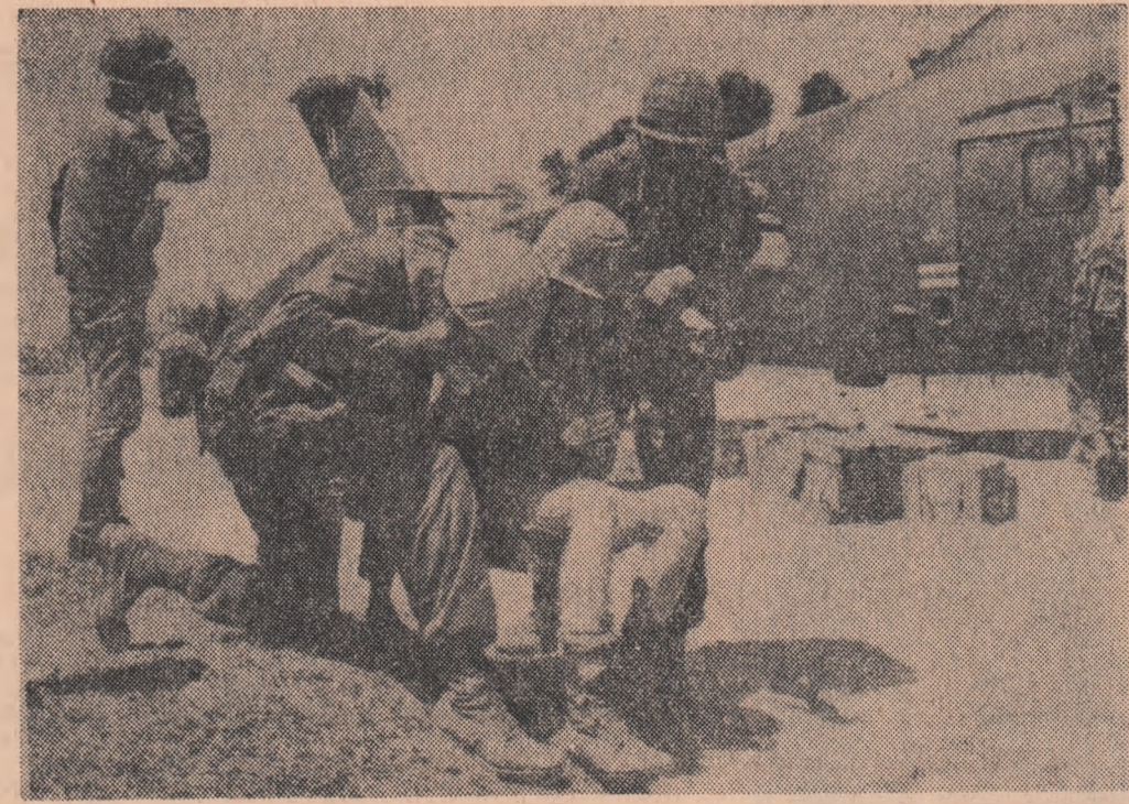
VIETNAMUL DE SUD. Militar american rănit în cursul unei lupte cu forțele patriotice