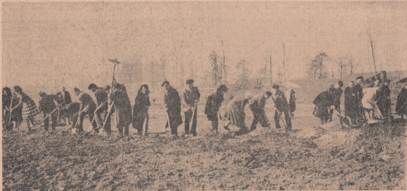
Prin muncă voluntară patriotică se amenajează un nou parc în cartierul Floresca, din Capitală