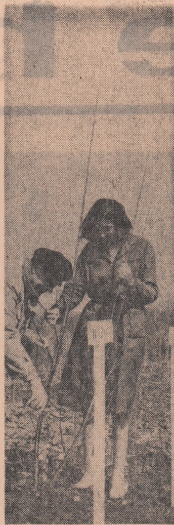
La stațiunea pentru cultura plopii și salciei din comuna Cornetu a început recoltarea altor

Ieri am înfîlțit cîteva sute de tineri de la G.A.S. Amzacea și cooperativile agricole de producție Pecineaga și Chirnogei curînd ogoarele de resturi vegetale și de pietrele scoase la suprafață. Numai la Chirnogei în două zile tinerii au scos de pe ogoare aproape 40 metri cubi de pietre. Lucrarea prezintă multă importanță pentru realizarea unor însămînțări de calitate — uniforme, în rînduri drepte.