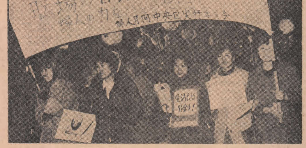
JAPONIA. Femei demonstrând împotriva creșterii prețurilor

Este vorba de scrisoarea adresată de unul dintre cei arestați, Marcel Le Roy, fost șef al unei secții a serviciilor franceze de contraespionaj, judecătorului de instrucție în această scrisoare, inculpatul pune în cauză pe seși săi din serviciile amintite, carp nu ar fi pus în valoare informațiile pe care el