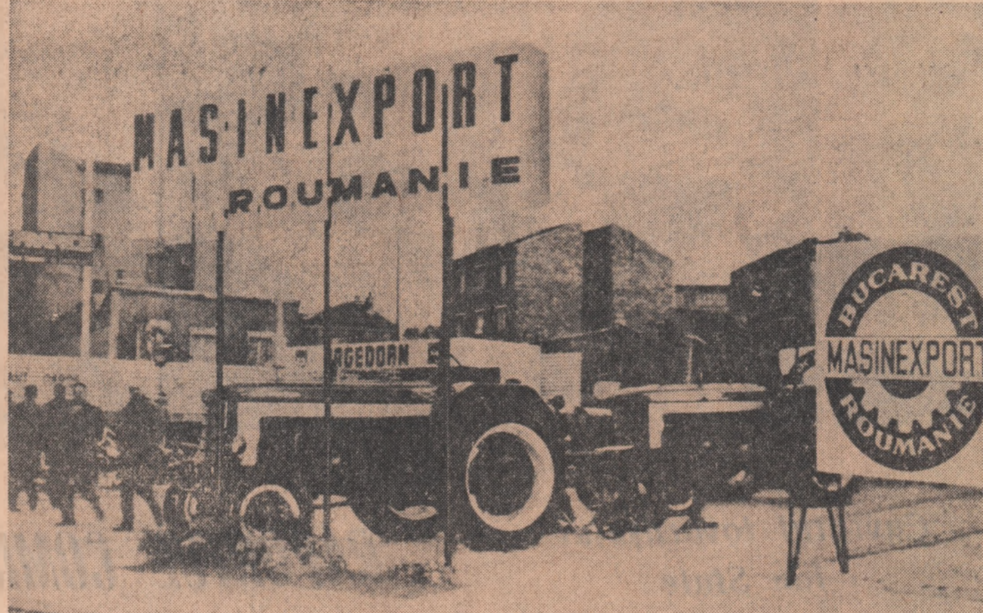
FRANȚA. La standul românesc din cadrul Salonului internațional de agricultură de la Paris