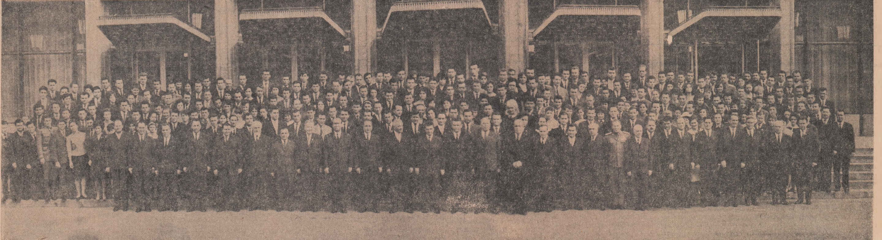
Conducătorii de partid și de stat în mijlocul Comitetului Central al U.T.C. ales la cel de-al VIII-lea Congres.