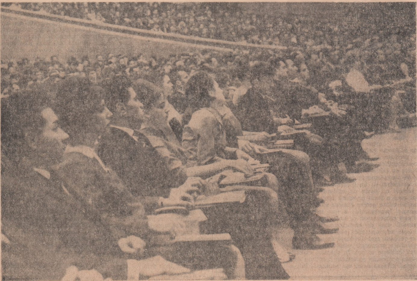
Imagini din sala Congresului

Congresul asigură Partidului Communist Român, Comitetul său Central, că Uniunea Tineretului Communist nu-și va precupeți eforturile, luptînd împreună cu întregul popor muncitor, sub steagul glorios al partidului, pentru desăvîrșirea construcției socialiste, pentru înălțarea mărețului edificiu al comunismului în minunata și în veci slăvita noastră patrie, Republica Socialistă România.