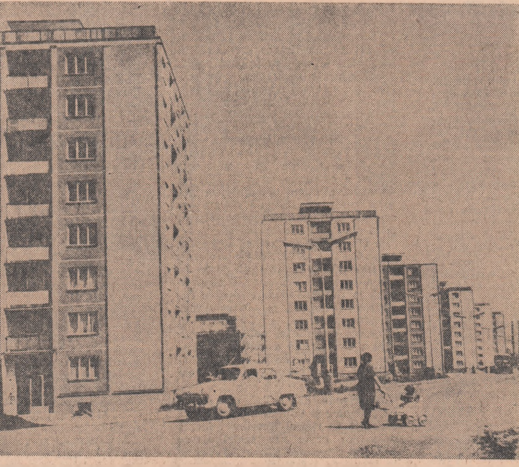
R. S. CEHOSLOVACA. Noi blocuri de locuințe în orașul Billina

dera clasamentului. Petrolul Pitești susține o ducioasă partidă la Galați în compania Siderurgistului. La Timișoara, formația locală Politehnica primește replica echipei Dinamo București, în timp ce la Iași se întinse: formațiile C.S.M.S. și U. T. Arad, ocupantele locurilor 3-4.