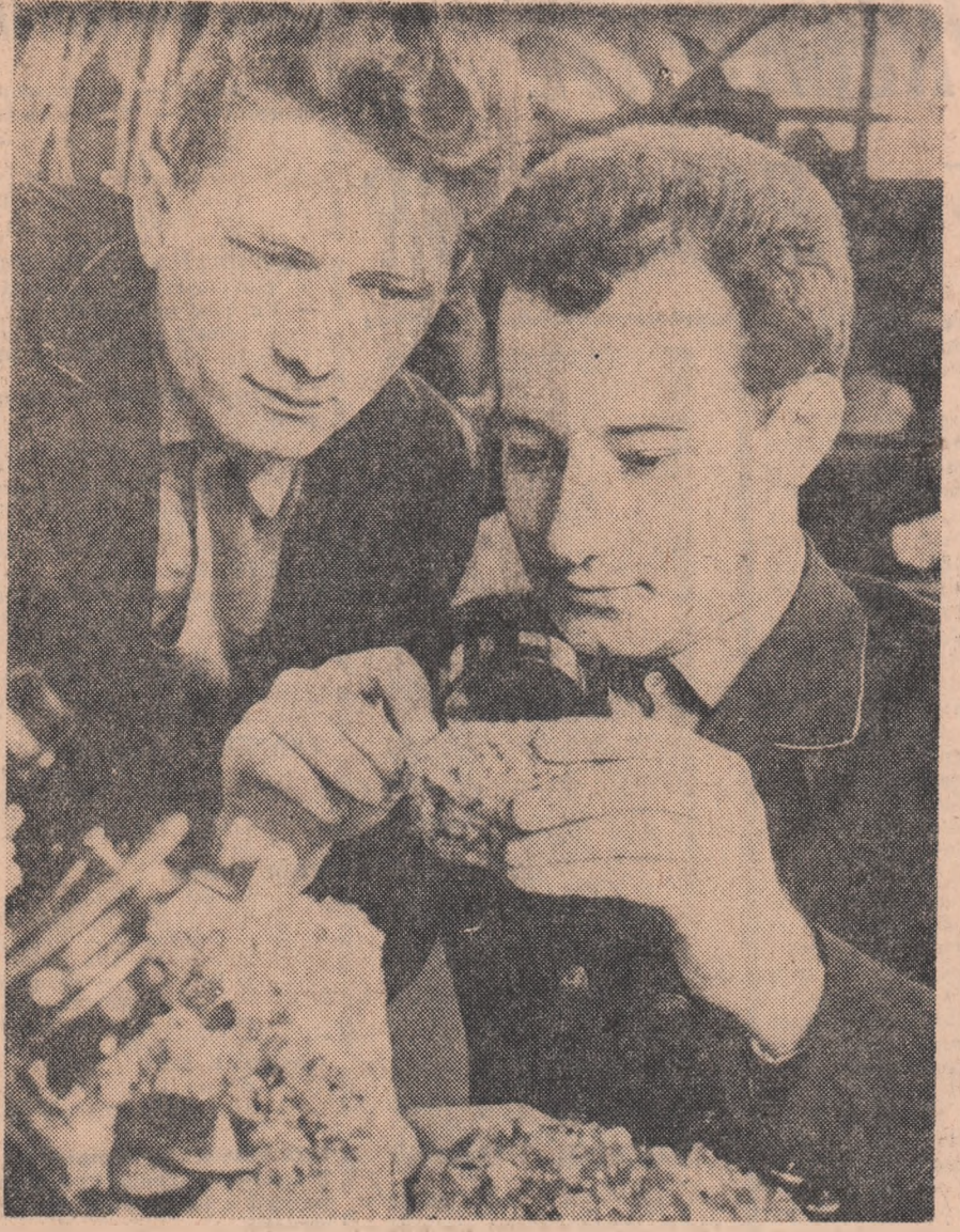
Institutul de mine din Petroșeni. După orele de curs studenții își continuă studiul în laborator.