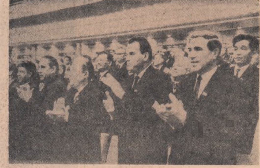
U.R.S.S. — Imagine din sala Palatului Congreselor din Moscova unde își desfășoară lucrările al XXIII-lea Congres al P.C.U.S.

● POTRIVIT relațiilor postului de radio Sanaa, țările republicane venite în interceptat în regiunea Wadi Haib o caravană de mașini care transporta armament și muniții și care a încercat să pătrundă pe teritoriul Republicii Arabe Yemen venind din Arabia Saudită. Întreaga caravană a fost capturată.