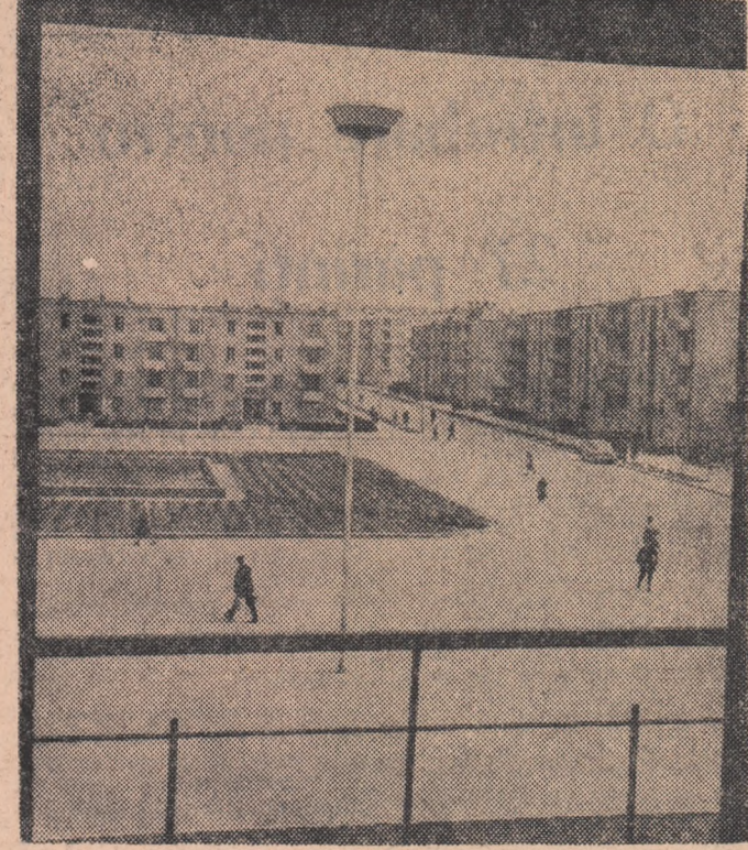
Perspectivă nouă pe strada Isaccea din Tulcea

Anul XXII, seria II, Nr. 5245 4 PAGINI — 25 BANI Miercuri 30 martie 1966