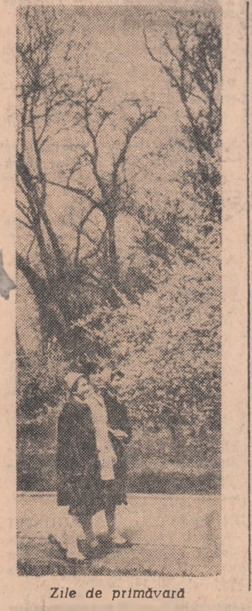
Zile de primăvară

GH. FICIORU (Continuare în pag. a III-a)