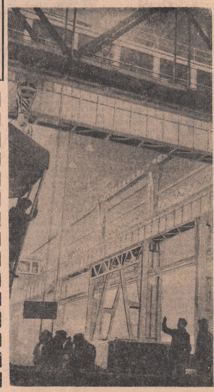
Activitate febrilă a montorilor laminotului de tablă groasă din Combinatul siderurgic Galați. Colosul va produce nu peste mult timp, primele cantități de oțel laminat.

— Iar despre Tănase pot să vă vorbesc eu — a continuat