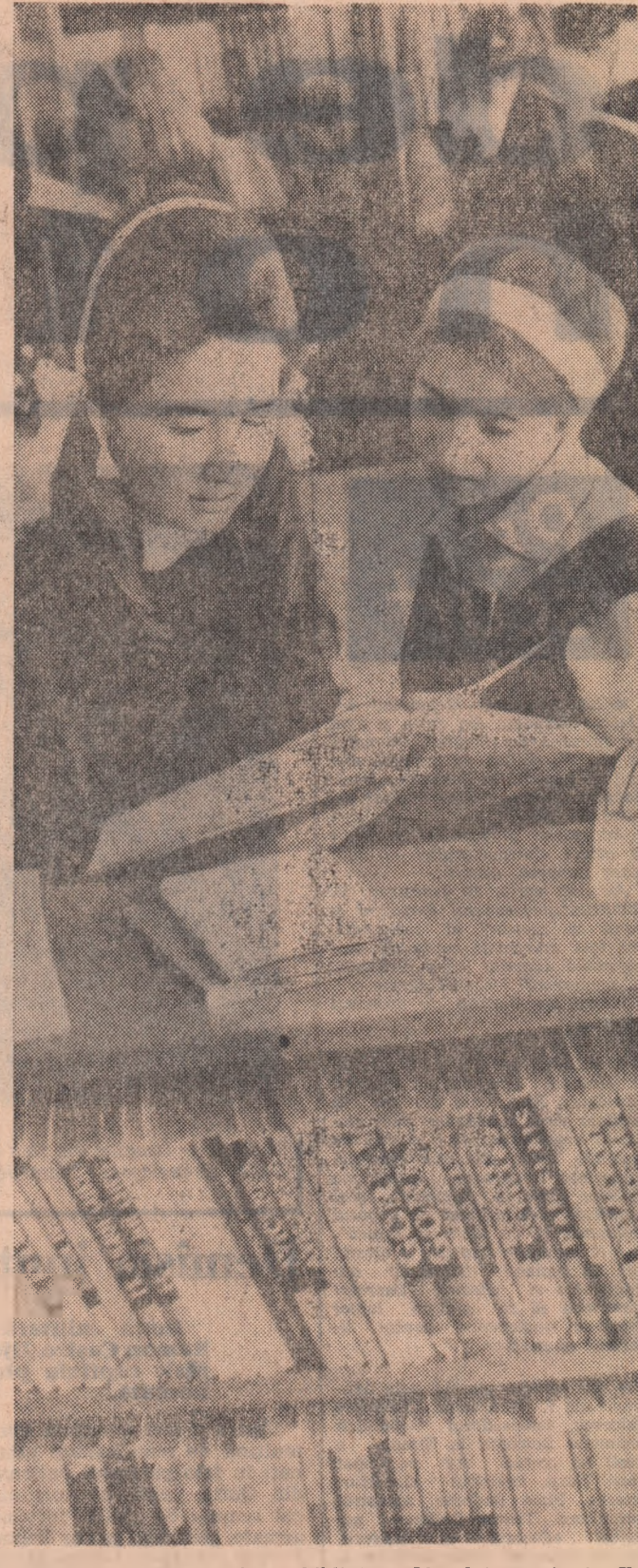
Popas în lumea cărților... (biblioteca liceului nr. 4 din Tg. Mures)