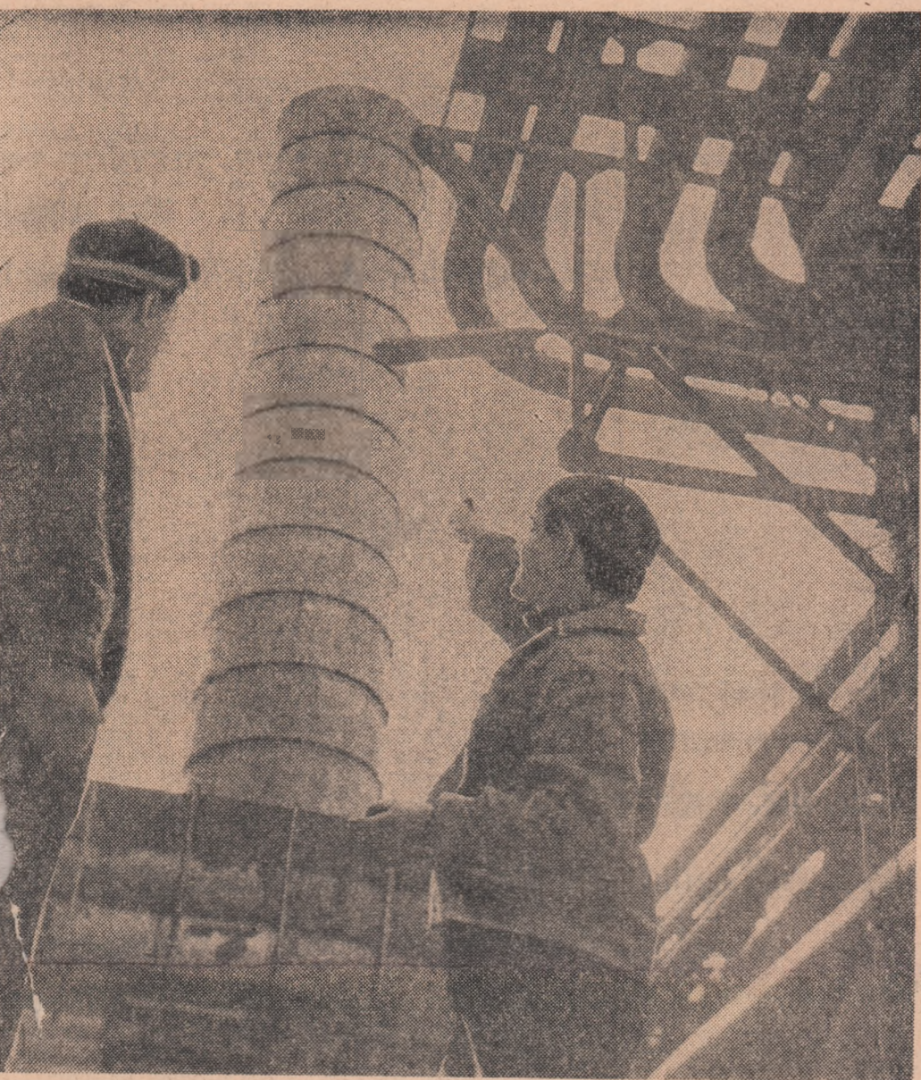
Detaliu exterior al termocentralei nr. 3 a Combinatului siderurgic Hunedoara

GALAȚI (de la coresponden- tul nostru). — Colectivul de muncă din 30 de întreprinderi și unități economice de pe cuprinsul regiunii Galați au raportat îndeplinirea înainte de termen a sarcinilor de plan prevăzute pentru trimestrul I. Printr-o acțiune de tip „școala” și prin eforturile tuturor muncitorilor din Galați, care a expedit peste plan furnalelor fieri aproape 15.000 tone de minereu de fier. O altă binecunoscută întreprindere gălățeană — Uzina mecanică — și-a realizat cu 4 zile mai devreme indicul de plan pe primele trei luni ale producției globale și a produs în același timp, productivitatea muncii a crescut cu 2,1 la sută.