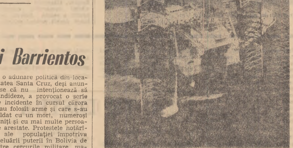
FRANȚA. Vedere a platformei de cercetări petroliere în mare. Instalația și-a început de curând lucrările de foraj în Golful Gasconiei

Una din sarcinile principale este cercetarea câmpului gravitațional al Lunii în funcție de schimbarea parametrilor orbitei satelitelui ei artificial. Legătura cu „Luna-10” este stabilă, informațiile științifice provenite de la bordul satelitelui se află în curs de prelucrare.