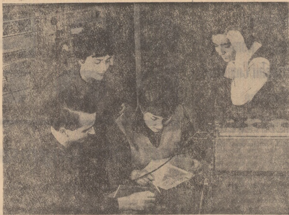
O imagine cotidiană în facultate: studenții lucrând în laborator

Plecarea delegației Tineretului Socialist din Japonia care a participat la Congresul U.T.C.