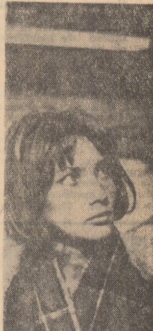
Cadru din filmul „Beata”

BEATA rulează la Doina (orele 11,30; 13,45; 16; 18,15; 20,30). Lira (orele 15,30; 18; 20,30). În completare Pirvu Mutu-zugrăvu.