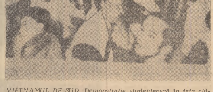
VIETNAMUL DE SUD. Demonstrație studențească în fața clădirii postului guvernamental de radio de la Saigon

În ce privește participarea statului la industria aeronautică, această în special de renunțarea la construirea bombardierului „T.S.R.-2” în favoarea achiziționării aparatului american „F-111”, este considerată drept o măsură necesară.