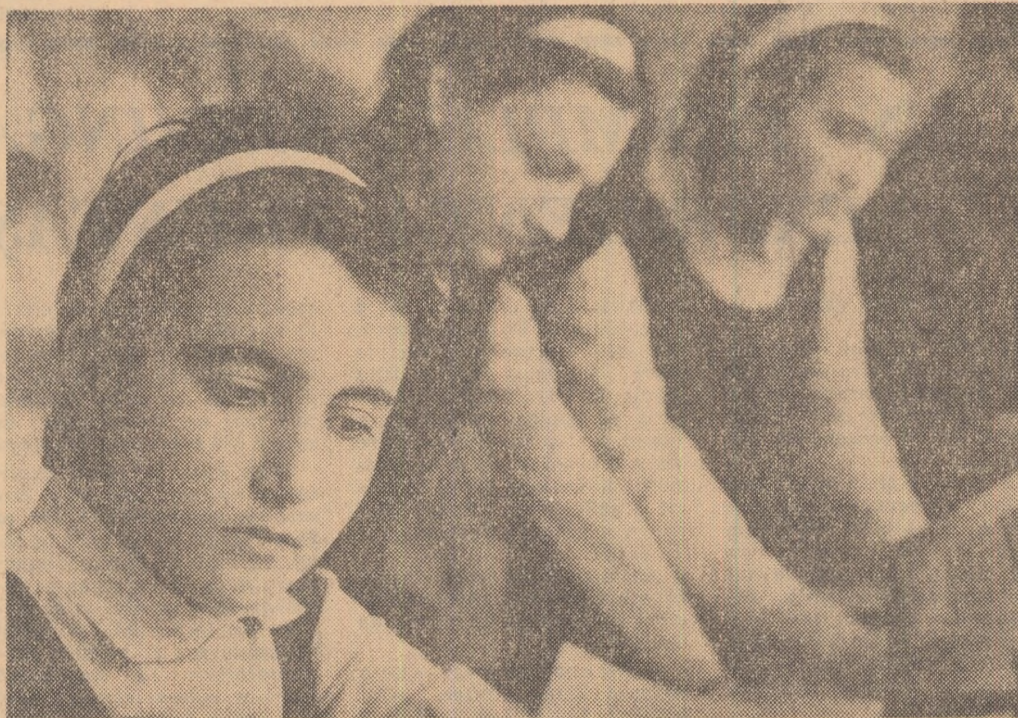
În biblioteca Liceului nr. 2 din Hunedoara

sească acolo ceva, care alături de bilețelul primit, ar fi solicitat pe prezent la câteva minute de meditație. Acel ceva era „Angajamentul de pionier“ al băiatului absent, scris cu patru ani în urmă, mai bine zis pictat cu patru ani în urmă, o adevărată lucrare de expoziție școlară, dovedind o migală care a presupus ore în șir de muncă plină de dragoste, de respect. Contrastul între aspectul acestuia și bilețelul motololit, pătat cu cele câteva vorbe vagi aruncate în grabă, a provocat la copiii o reacție imediată care, așa cum se aștepta instructorul și așa cum era firesc să se întâmple, nu s-a limitat doar la o discuție în jurul unei chestiuni, să-i spunem, „de formă“, de „prezentarea grafică“, depin-