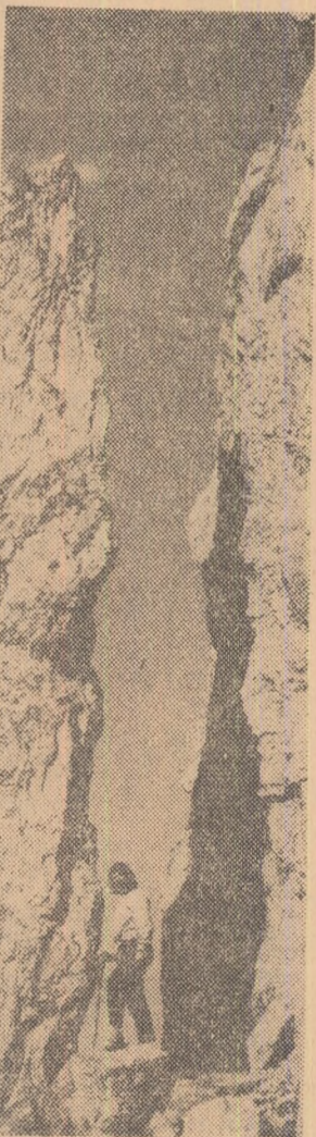
Masivul Rarău — În marea spintecătură a „Pietrelor Doamnei“