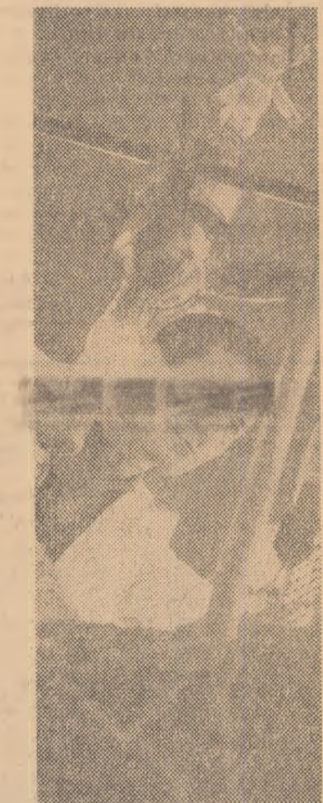
În laboratorul de semiconductoare al Institutului de fizică al Academiei