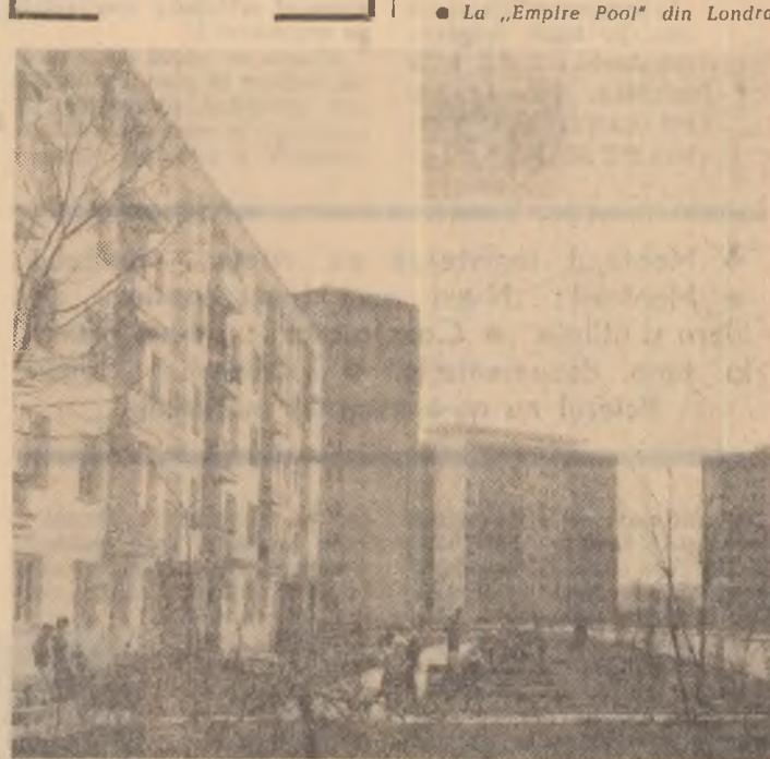
Aspect cotidian din noui cartier bucureștean Pajura

Evocând lupta glorioasă dusă de P.C.R. în cei 45 de ani de existență, vorbitorul s-a referit la victoriile dobândite, la capătul cărora strălucește chipul României de astăzi, al României socialiste. Vorbitorul a înfățișat apoi tabloul puternicei dezvoltări economice și social-culturale