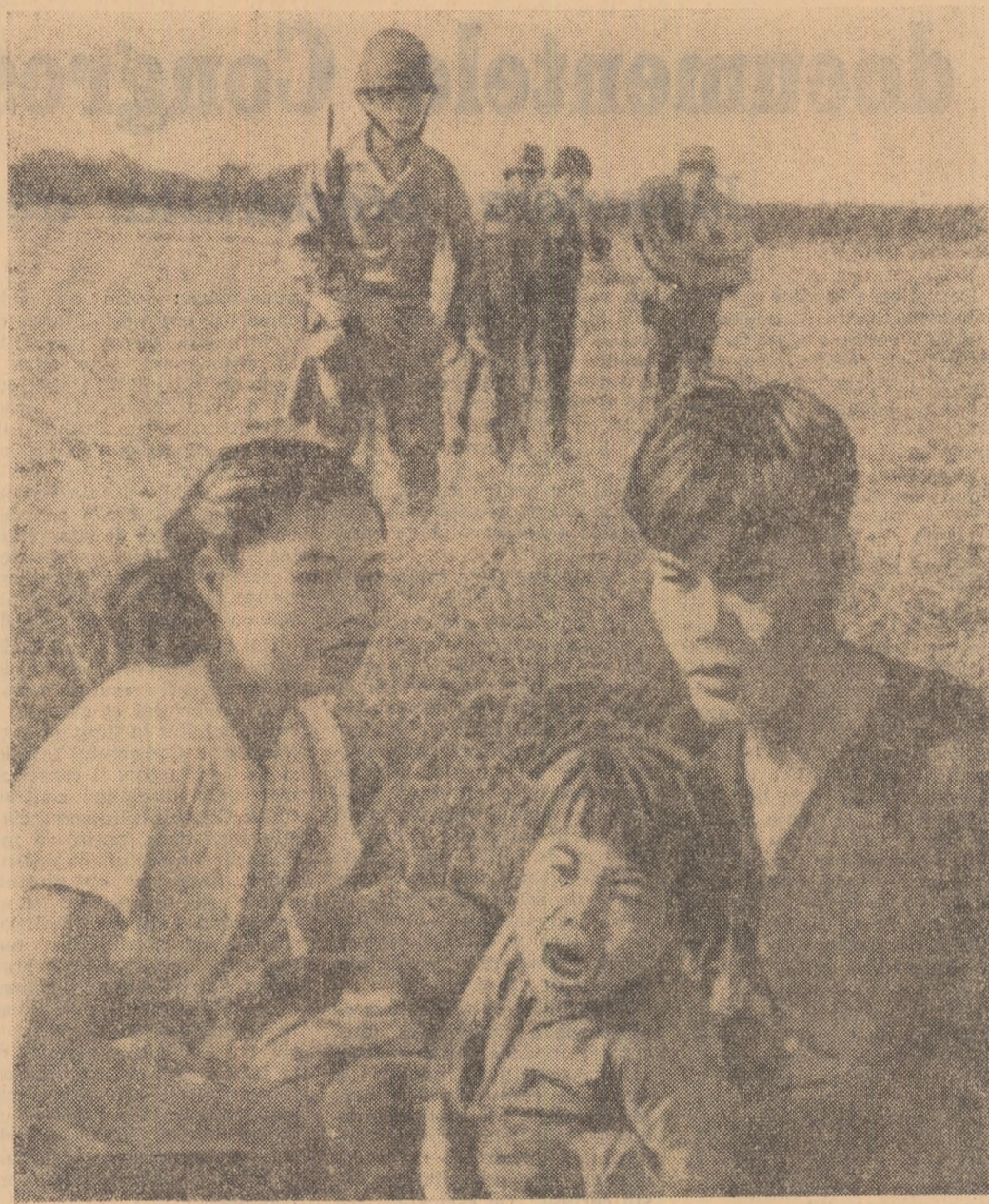
Un cîmp de orez în apropierea Saigonului. O familie de țărani, hăituită literalmente de soldații americani și mercenarii saigonezi. Mama strînge în brațe copilul sfîrtecat de gloată. Tatăl, categorisit „suspect”, cu minile legate la spate, așteaptă, poate, din clipă în clipă, glonțul ucigaș. Documentul acesta fotografic transmis de agenția U.P.I. ne dezvăluie un strop din oceanul de suferințe adus de agresorii americani pe cîmpurile însingurate ale Vietnamului de sud.