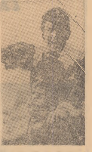
Cadru din filmul „După mine canali!”

CORĂBILE LUNGI — cinematoscop rulează la Patria (orele 8,30; 11; 13,30; 16; 18,45; 21,15); București (orele 9,30; 12,15; 15,30; 18,15; 20,45); Melodia (orele 8,30; 11; 13,30; 16; 18,45; 21,15); Aurora (orele 9,30; 12,15; 15; 17,45; 20,30).