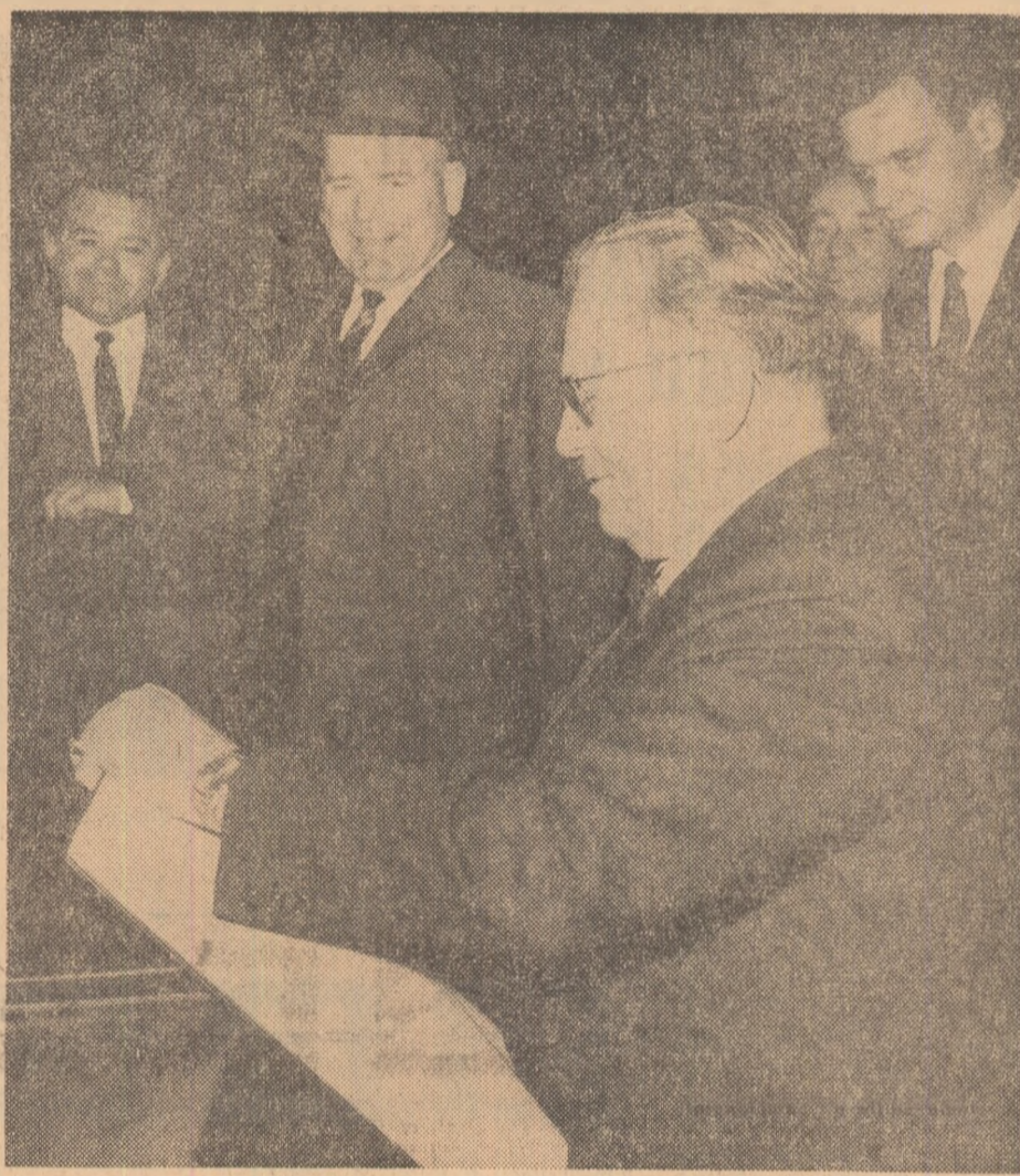
Președintele Tito semnând în cartea de onoare a fabricii