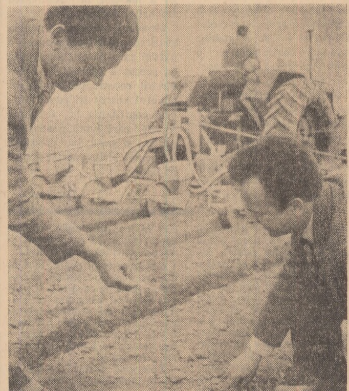
Însămînțatul porumbului e în toi. Imagine de la C.A.P. Chiajna, regiunea București