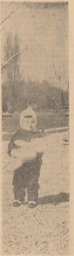
La plimbare prin Parcul Herăstrău