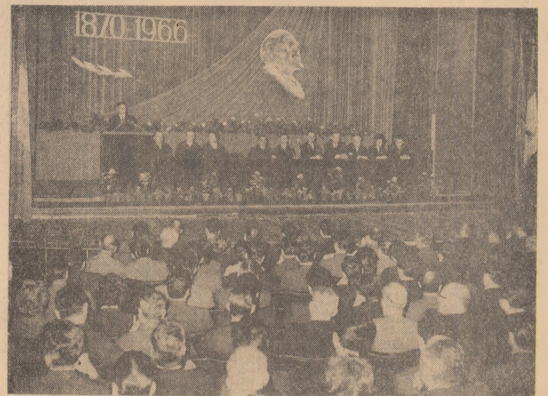
În sala Teatrului C.C.S. din Capitală, în timpul adunării solemne