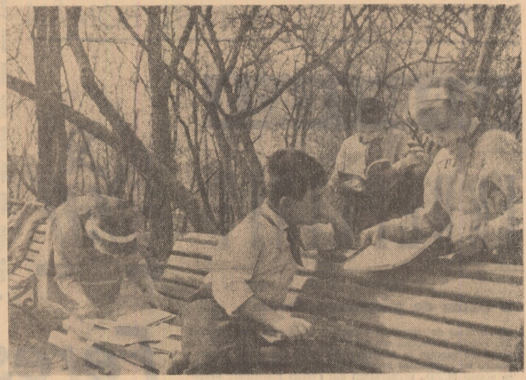
Clupe de recreere în parc