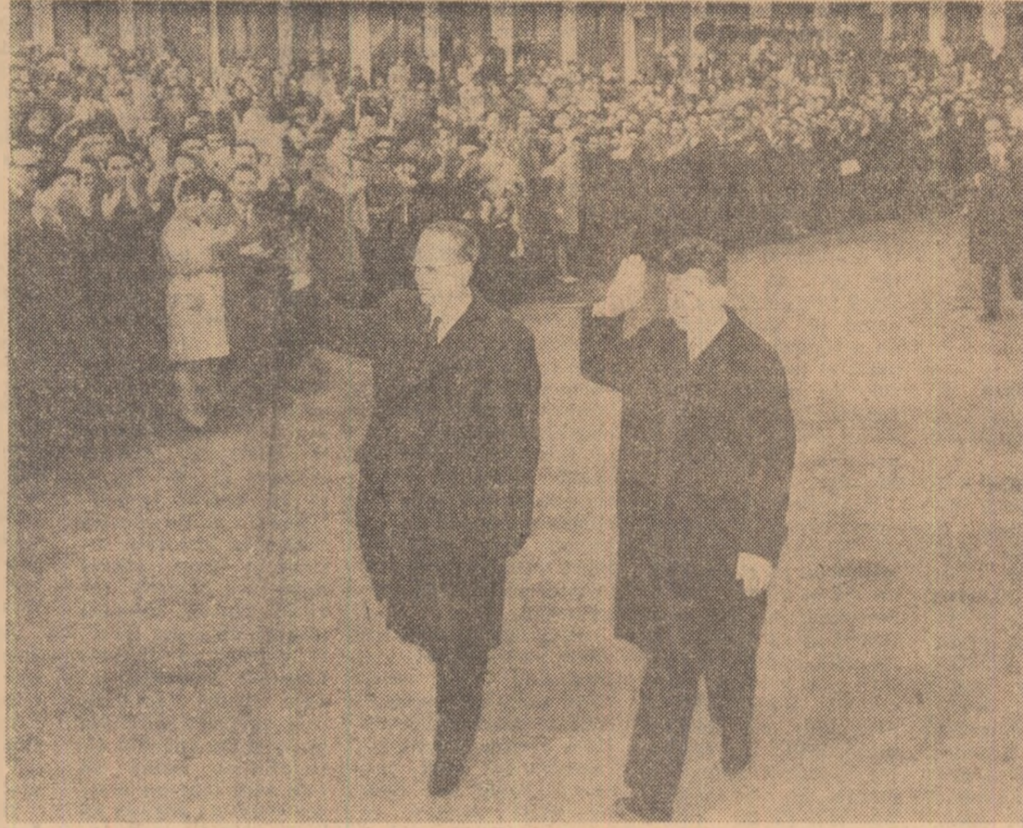
Pe întreg traseul, ca și pe aeroport, bucureștenii și-au luat un călduros rămas bun de la tovarășul Iosip Broz Tito.