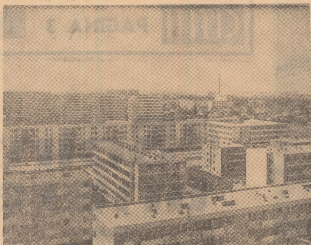
Noi blocuri întregesc peisajul urbanistic al Capitalei. Vedere din cartierul Balta Albă.