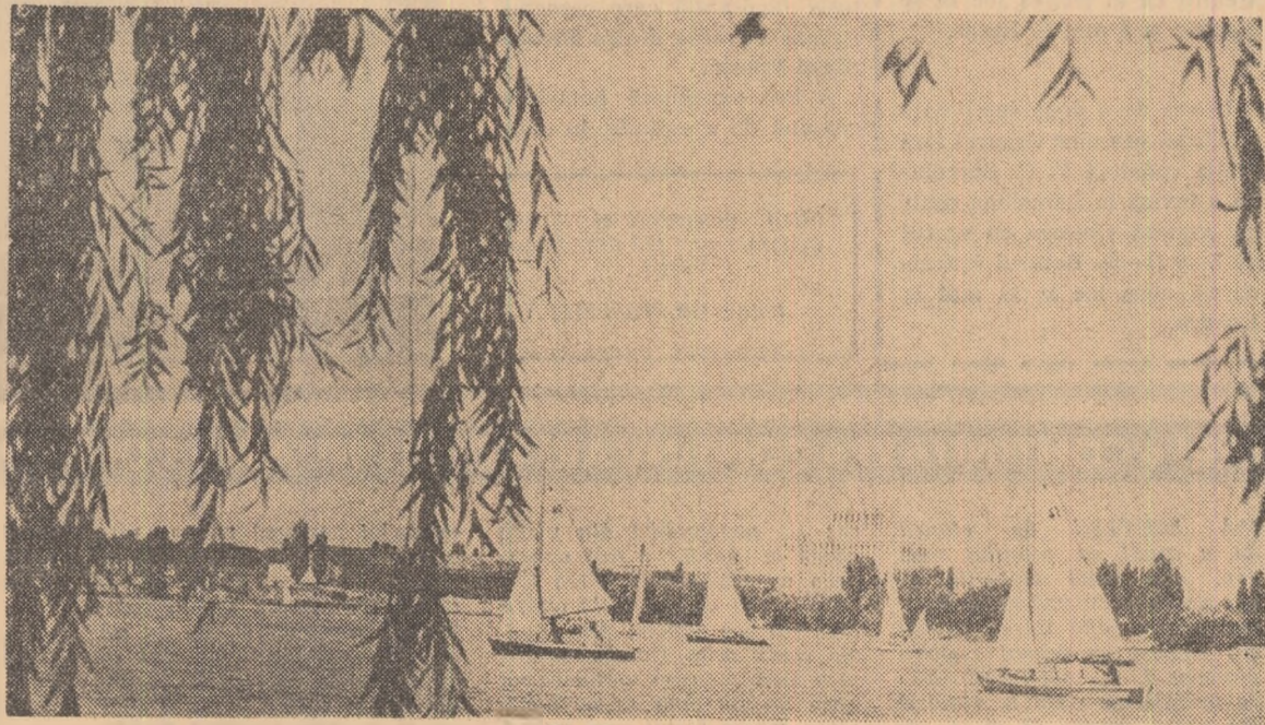
Primăvara pe lacul Herdstrău

AURELIA POPESCU (Continuare în pag. a II-a)