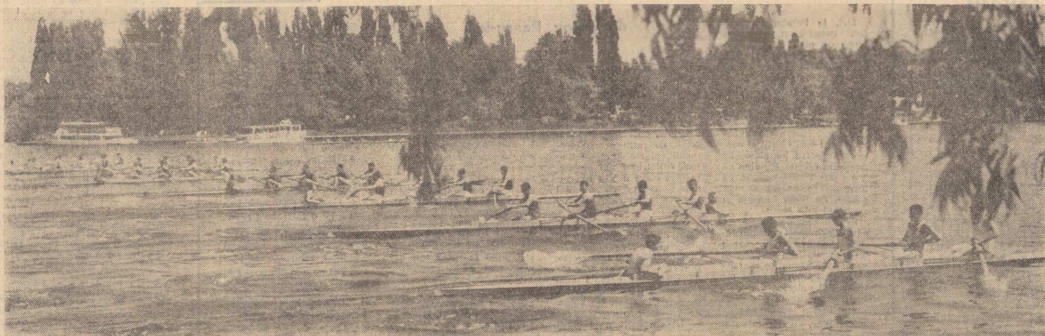
Intrecerile din cadrul primului concurs de canotaj al anului, deslăș... pe iacul Herăstrău, au avut două dominante: tinerețea și disputa pasionantă pentru victorie