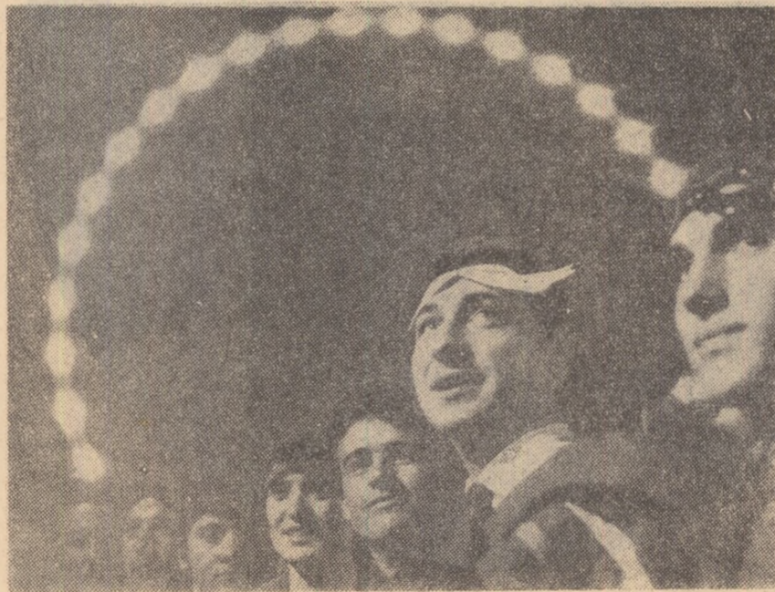
Ritm și zumbet