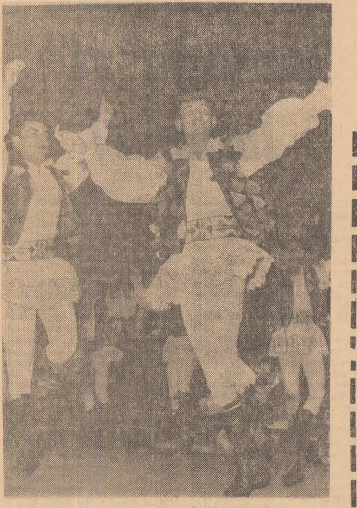
Echipa de dansuri a Centrului universitar Tirgu Mureș prezintă o suită de dansuri de pe Valea Nîrajului