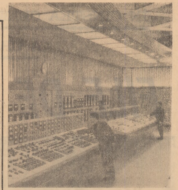
Combinatul de celuloză și hîrtie Brăila — camera de comandă a centralei termoelectrice 2 A.