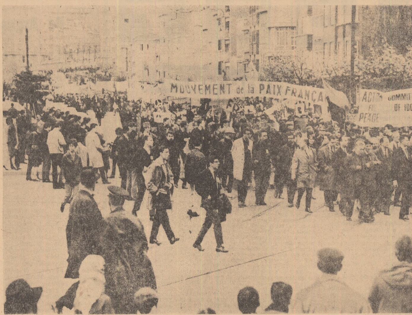
În mai multe orașe occidentale au avut loc recent puternice manifestații pentru pace, împotriva înarmării atomice. Din numeroasele coloane ale păcii, fotografia noastră înfățișează pe aceea care a deliaat zilele trecute pe strazile Bruxellesului