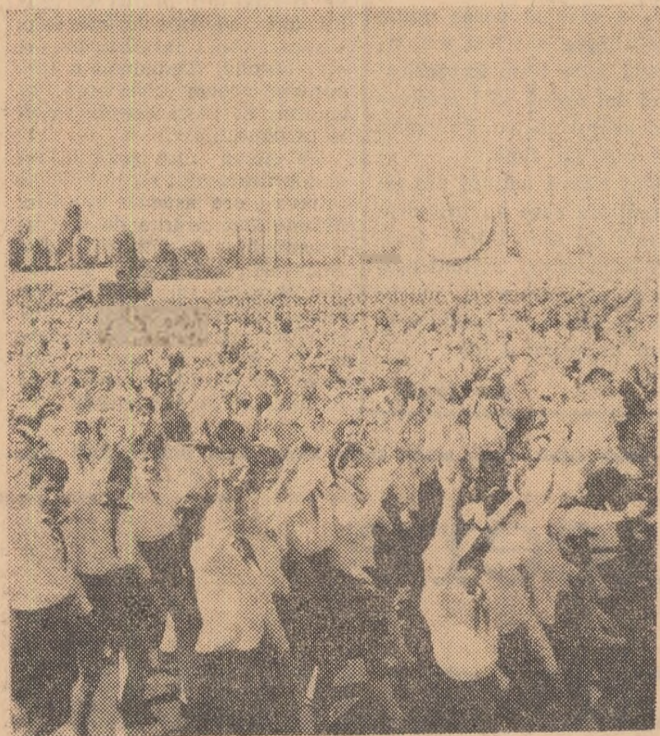
In marea coloană, de 1 Mai