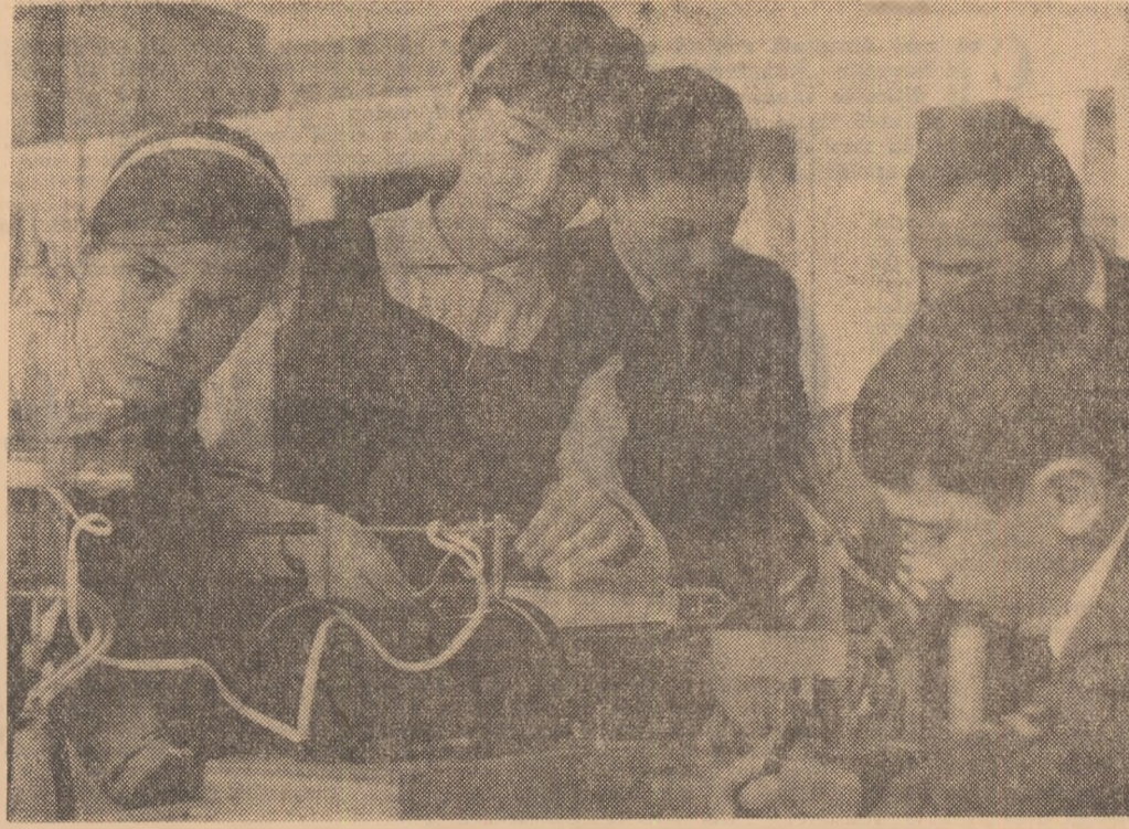
In laboratorul de fizică din elevii clasei a X-a B de la Liceul „V. Alecsandri” din Galați.