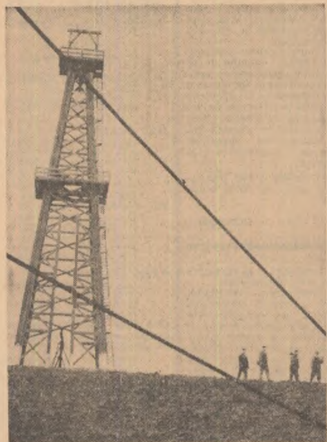
Imagine obișnuită în peisajul industrial al regiunii Ploiești