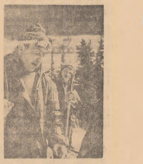
Cadru din „O clasă neobșnuită”

HAI DUCUI — cinemascop — CABINETUL DE STAMPE rulează la Patria (orele 9,15; 11,30; 13,45; 16,30; București (orele 9,15; 11,30; 13,45; 16,30; 18,45; 21) în completate VIRSTA, Modern (orele 9; 11,15; 13,30; 16; 18,30; 21) Grivița (orele 9,45; 12; 14,15; 16,30; 18,45; 21). ADEVĂRATA FAȚĂ A FASCISMULUI rulează la Republica (orele 9,30; 12,15; 15,15; 18; 20,45). FATA DIN JUNGLA rulează la Central (orele 9; 11,15; 13,30; 15,45; 18,15; 20,45). INSPECTORUL în completare SCOAȚE POPLARE rulează la Capitol (orele 10; 12; 14; 16,15; 18,30; 20,30; Feroviar (orele 9,30; 11,45; 14; 16,15; 18,30; 20,45).