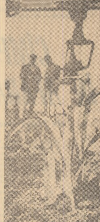
După ce mecanizatorul a spart crusta și a distrus buruienile, porumbul se dezvoltă mai viguros