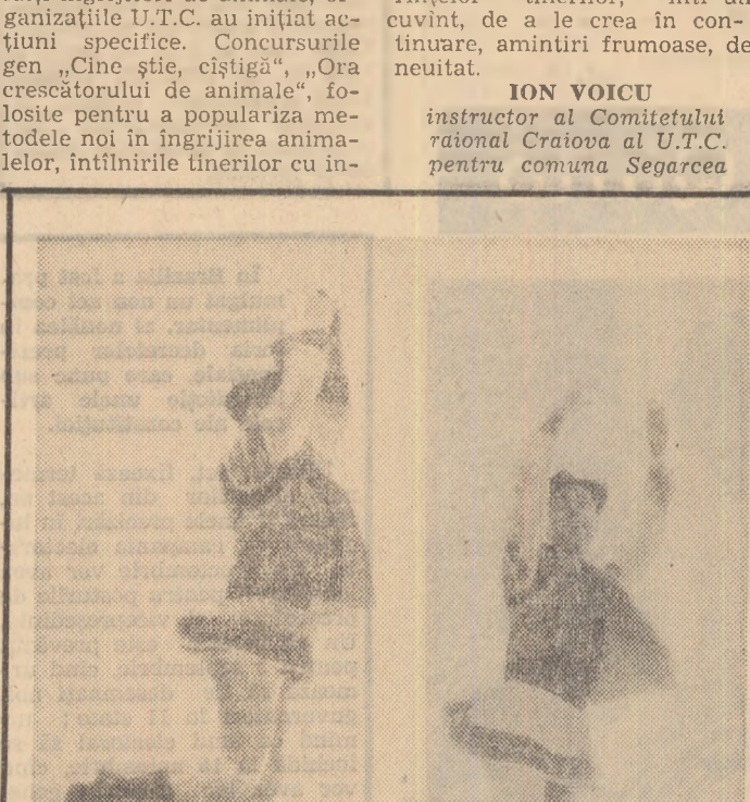
Joc moldovenesc lângă străvechea cetate a Sucevei

cooperativa noastră agricolă în 1970”. Pe bază de cifre și fapte s-a purtat o discuție concretă și mobilizatoare. De neuitat sînt înfîlîturile cu activiști de partid și de stat cu prilejul cărora s-a discutat despre trecutul de luptă al partidului nostru, despre rolul și scopul organizației U.T.C. Legat de lupta partidului pentru fericirea poporului, deosebit de instructive au fost vizitele din cei mai frumoși ani ai tineriei. De neuitat sînt înfîlîturile cu activiști de partid și de stat cu prilejul cărora s-a discutat despre trecutul de luptă al partidului nostru, despre rolul și scopul organizației U.T.C. Legat de lupta partidului pentru fericirea poporului, deosebit de instructive au fost vizitele din cei mai frumoși ani ai tineriei.