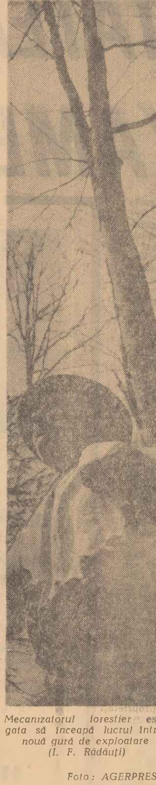
Mecanizatorul forestier este gata să înceapă lucrul într-o nouă zonă de exploatare (I. F. Răduțiu)