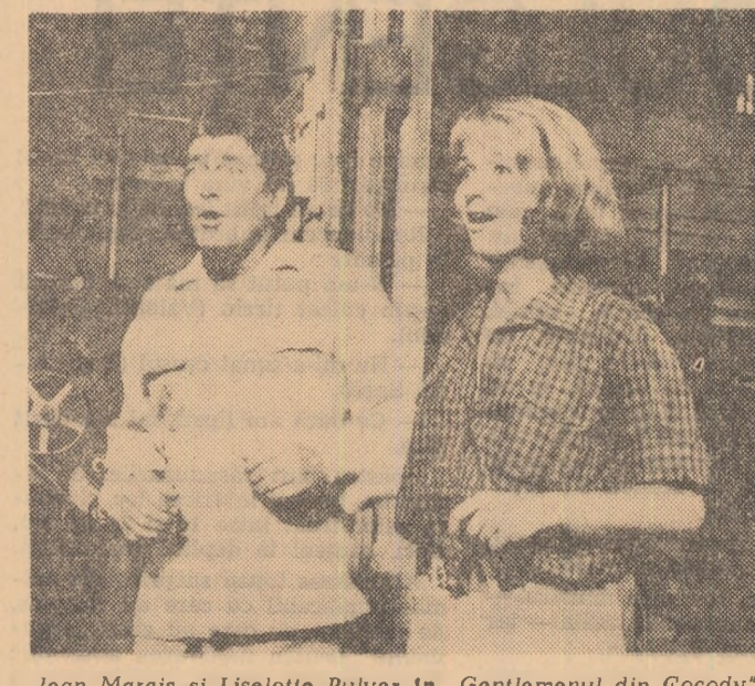
Jean Marais și Liselotte Pulver în „Gentlemen din Cocody”