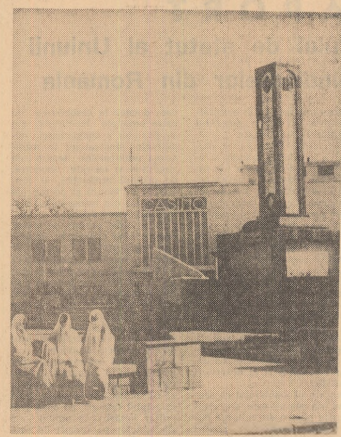
TUNISIA: Intr-o piață din Bizerta

producția de utilaj petrolier și de mijloace de telecomandă pentru construcția de mașin-unelte din țara noastră despre perfecționarea motoarelor asincrone, despre producția românească de tractoare, medicamente, mobilă. Expoziția a avut ca oaspeți numeroase persoane oficiale, membri ai conducerii unor ministere unionale, conducători ai unor instituții centrale de stat, delegații de specialiști sau de oameni de afaceri de peste hotare, aflate în acest timp la Moscova. Presa sovietică a acordat atenție expoziției, publicînd reportaje, interviuri, informații și fotografii.