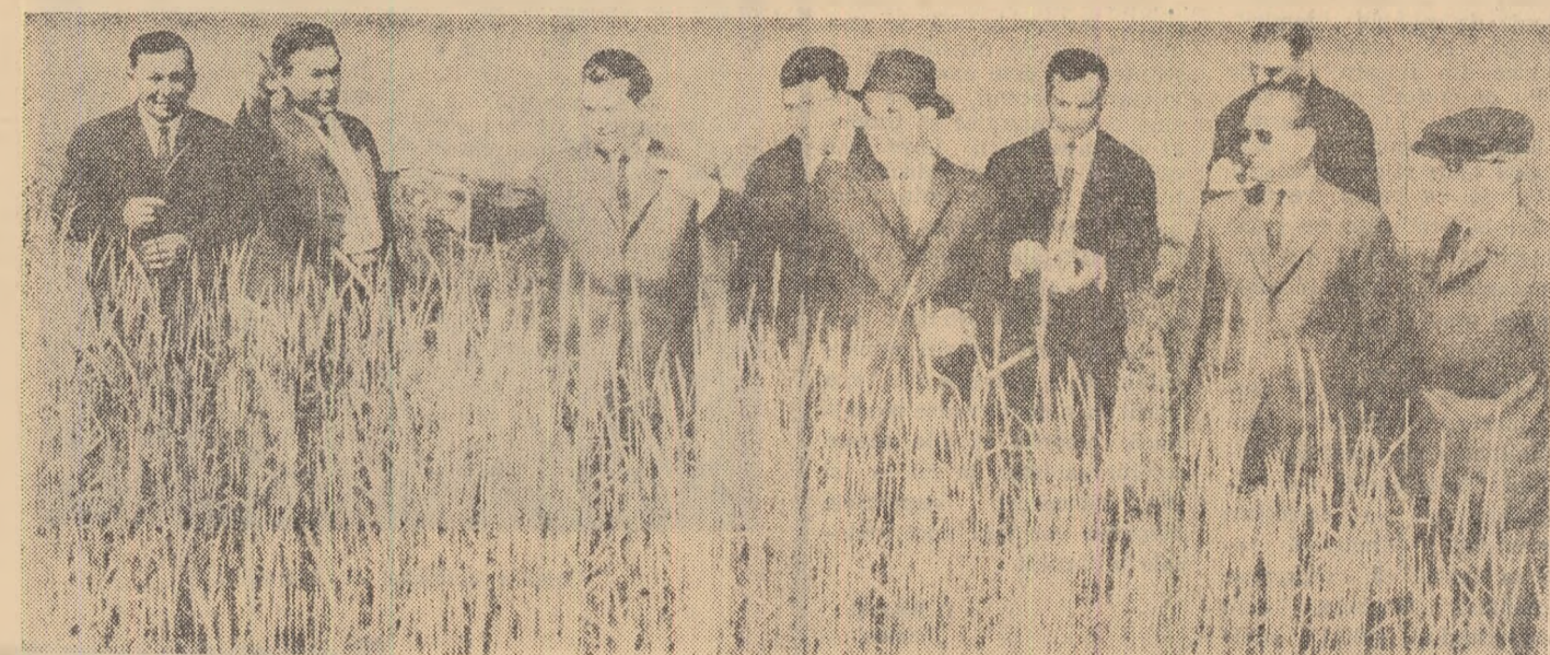
Cercetînd culturile irumos dezvoltate de pe holdele comunei Zorleni