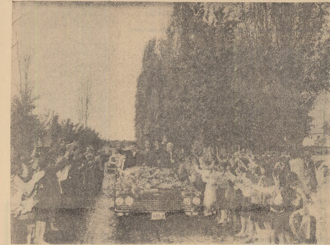
Birlad. Conducătorii de partid și de stat sînt întîmpinați cu entuziasm și nesfîrșite aclamații de locuitorii orașului