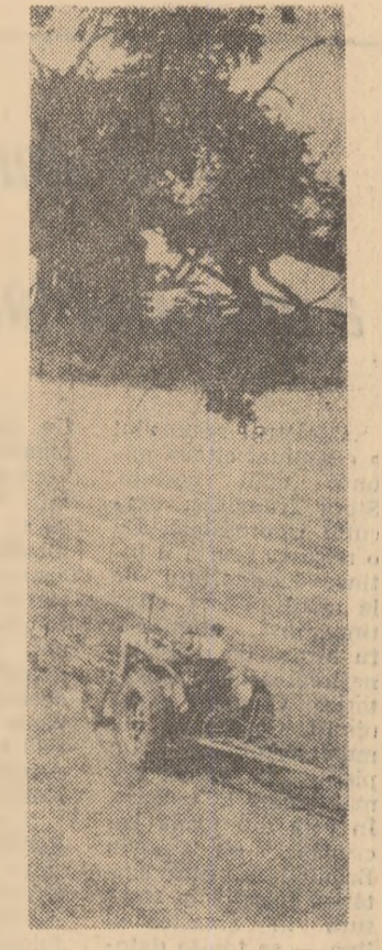
O lucrare care impune maximă urgență — recoltatul lucernei. (Imagine de la G.A.S. Bujoreni, regiunea București)