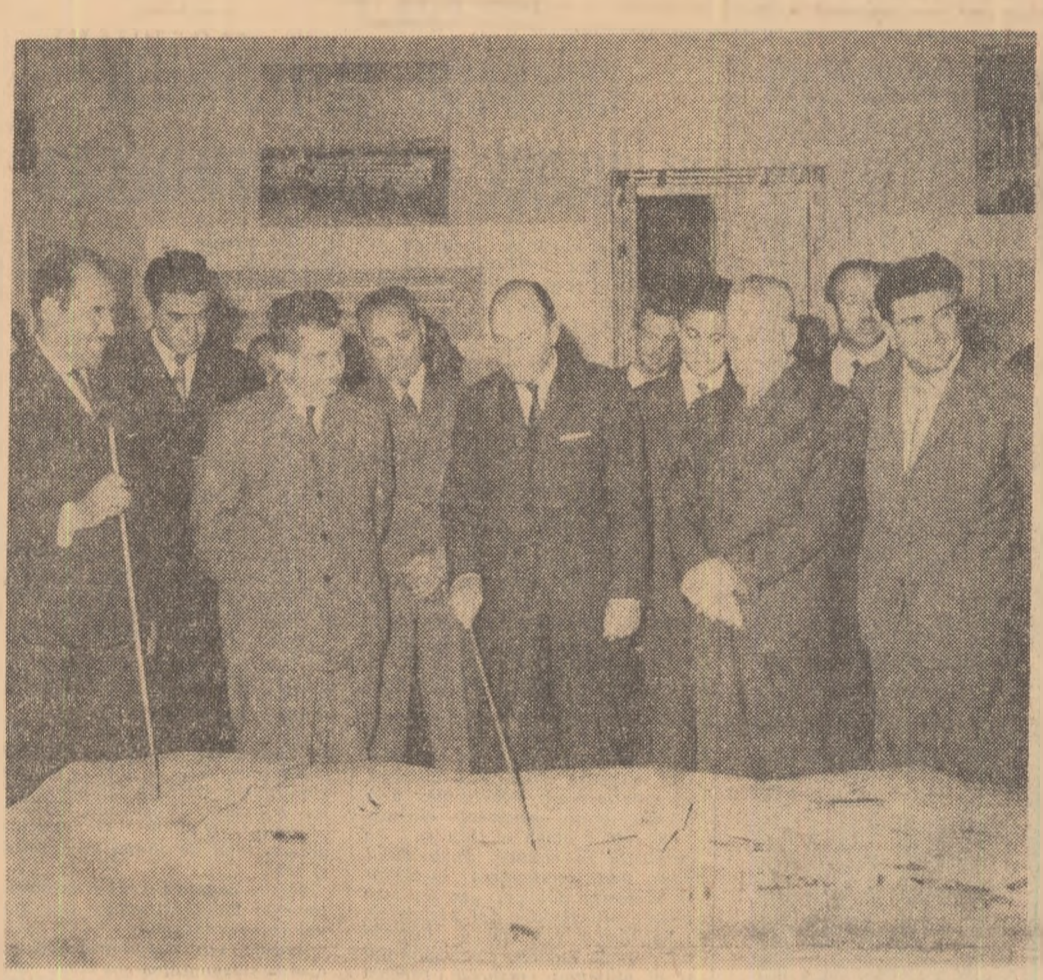
La Palatul culturii, în fața machetei în relief a Iașului

A doua zi a vizitei conducătorilor de partid și de stat în regiunea Iași începe sub lumina unui soare strălucitor, care aurește cele șapte coline pe care se află așezată vechea cetate de scaun, cupolele monumentelor istorice, siluețele verticalelor de beton și sticlă din noile cartiere. De la Bucium, de pe dealul Cetățuia, de la Repedeș se vede panorama largă a Iașului înnoit, mlațe de stăguri care-l împodobesc festiv.