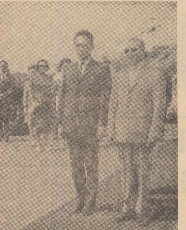
La sosire, pe aeroportul Băneasa

tinuare alți cărturari de prestigiu, printre care N. Iorga, Vasile Pirvan, atmosferă în care eminentul sociolog, profesorul Dimitrie Gusti, începe munca pentru realizarea unui muzeu care să reflecte dezvoltarea satului românesc. Între anii 1925 și 1935 profesorul Gusti, luptîndu-se cu greutățile financiare și lipsa de înțeles a guvernanților burghezi pentru acedid importanței operațiunii patriotice, nu dezarmează. Ajutat de câțiva cercetători pasionați și mai ales de studen-