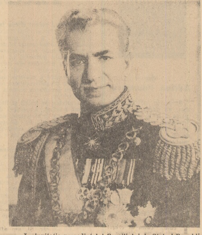
La invitația președintelui Consiliului de Stat al Republicii Socialiste România, Chivu Stoică, sosește astăzi în București Maiestatea Sa Imperială Mohammad Reza Pahlavi Aryamehr, Șahinșahul Iranului, care va face o vizită oficială în țara noastră, între 27 mai și 3 iunie.