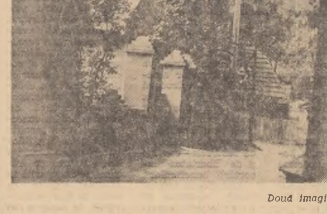
Două imagini din Muzeul satului

A cincea verigă — și dintre cele mai importante — trebuie să fie preocuparea uzinelor pentru creșterea nivelului profesional al muncitorilor, tehnicienilor și inginerilor în vederea obținerii unei specializări specifice fabricației de mașini-unelte.