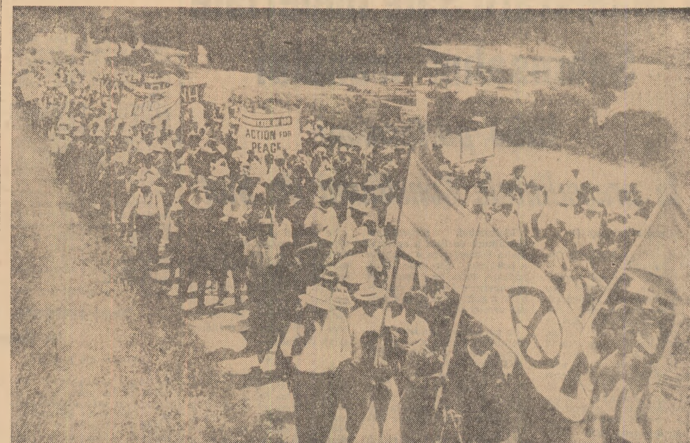
Pe istoricul traseu Maraton-Atena, s-a desfășurat recent un puternic marș pentru pace și dezarmare. În fotografie: Aspect din timpul marșului