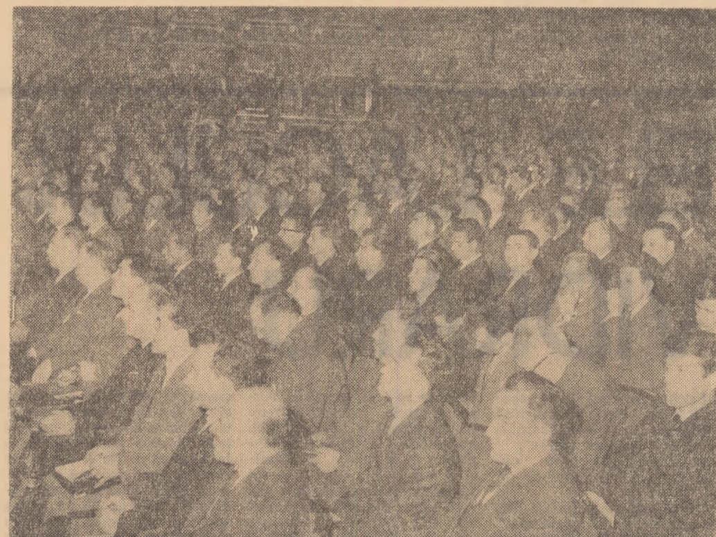
Aspect din timpul lucrărilor

O serie de sugestii rezultate din discuții se referă la probleme privind simplificarea formalițiilor de avizare și fundamentarea documentațiilor tehnice, formarea și stabilizarea cadrelor, asigurarea unei mai bune timicități în aprovizionarea cu materiale.