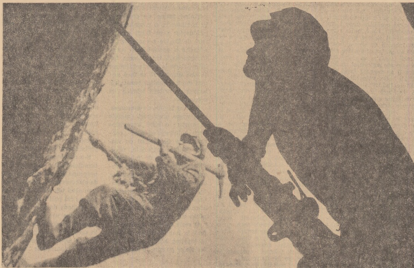
Teliuc... În zidul aspru — cetate carpatină. Fler căutăm în stîncă, și-l scoatem la lumină.

Primirea făcută de locuitorii (Continuare în pag. a III-a)