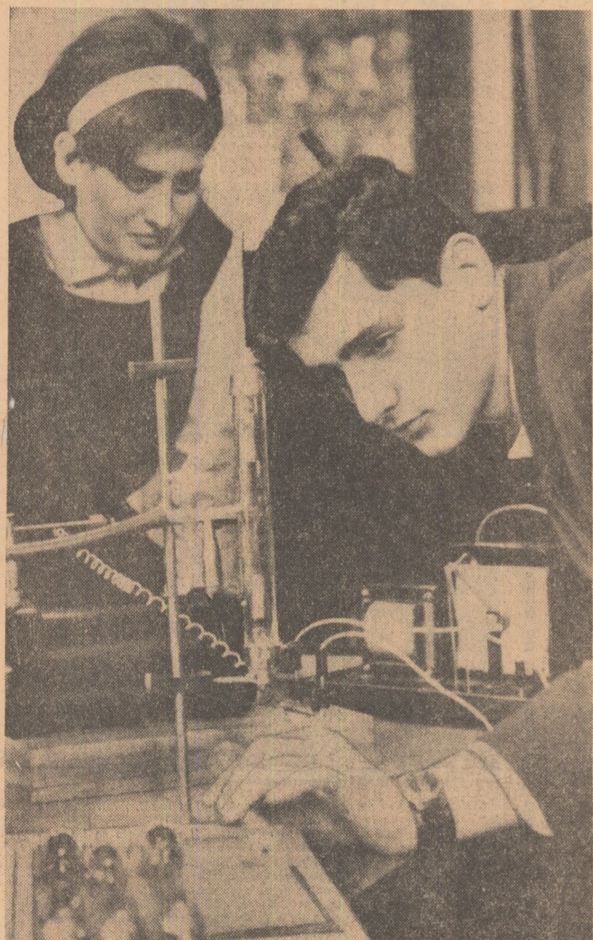
In laboratorul de fizică. Elevii ai clasei a X-a a Liceului „Nicolae Bălcescu” din Cluj