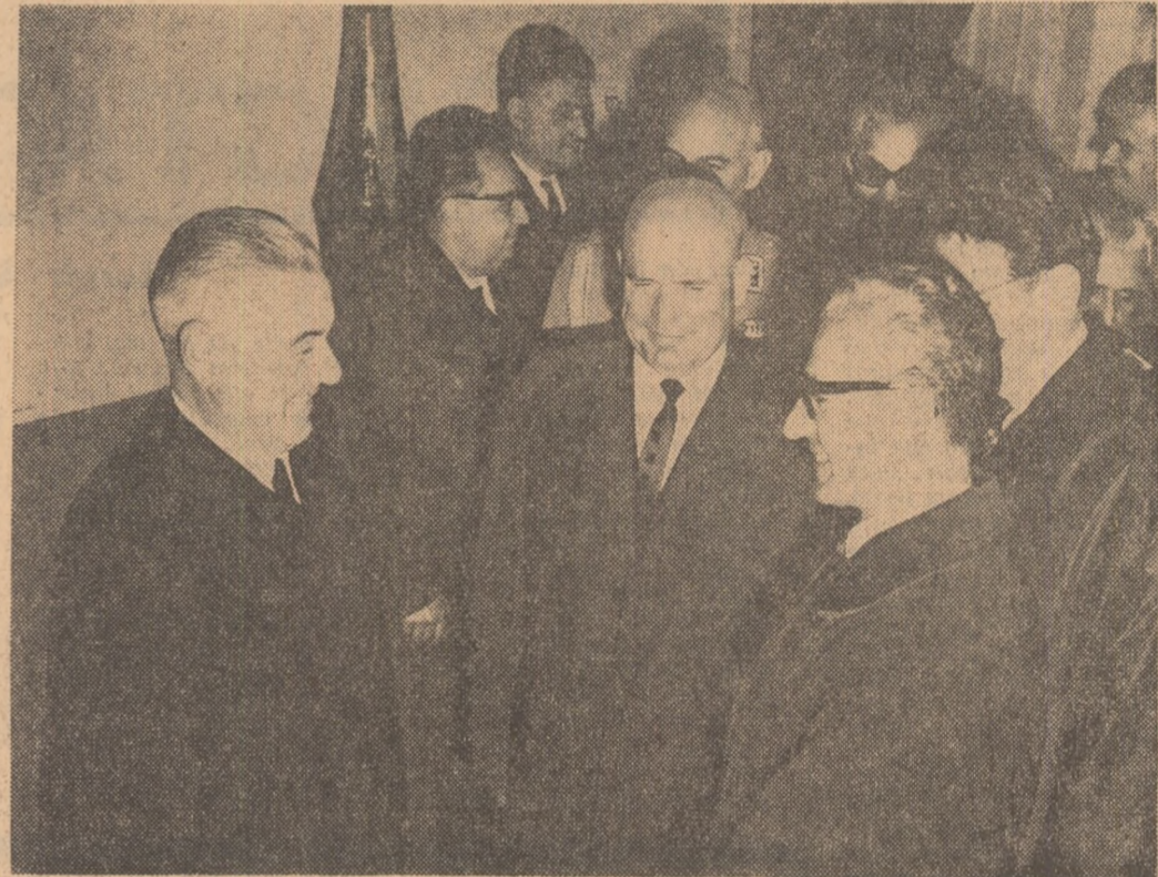
La plecare, pe aeroportul Băneasa

Vineri la amiază a părăsit Capitala Maiestatea Sa Imperială Mohammad Reza Pahlavi Aryamehr, Șahinșahul Iranului, care la invitația președintelui Consiliului de Stat al Republicii Socialiste România, Chivu Stoica, a făcut o vizită oficială în țara noastră.