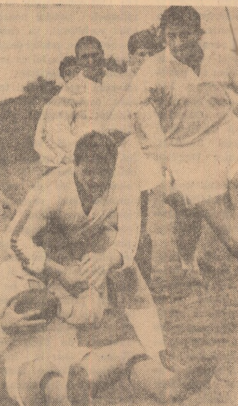
O secvență din partida de rugbi