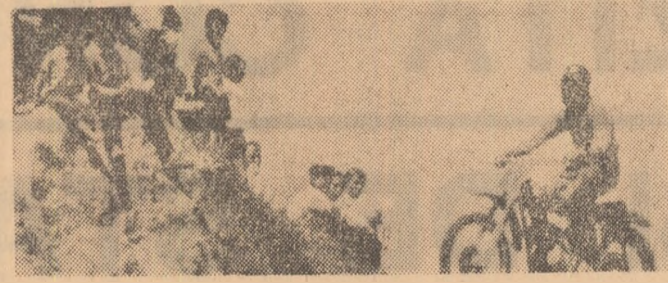
Amatorii întrecerilor de moto au avut duminică satisfacția de a urmări un spectacol arădător: etapa a II-a a Campionatului republican de moto cross

Ideea organizării unei duminici culturale-sportive n-a venit de undeva așa din senin. Ea are un autor binecunoscut: organizația U. T. C. din comuna Săbăreni, raionul Rădăuți. Când s-a stabilit programul pentru o cit mai bună reușită a acestei duminici, pentru a spori interesul publicului față de numeroasele puncte din program, dar mai ales pentru a stimula „concurența” dreaptă care, atât în sport cât și în acțiunile culturale, dă roade mult mai frumose, comitetul U.T.C. din Săbăreni a adresat o invitație de participare și organizației U.T.C. din comuna megieșe Cosoba, Joița, Gulia, Brezocile și celei de la I. C. A. B. Joița. Bucuroși de invitație, concurent cu tinerii din Săbăreni și ceilalți