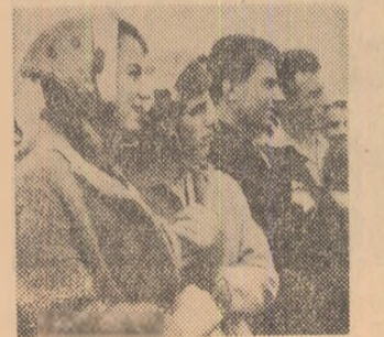
Duminică cultural-sportivă din comuna Săbăreni în patru imagini

— Gata, începem!... Vestea venea de la terenul