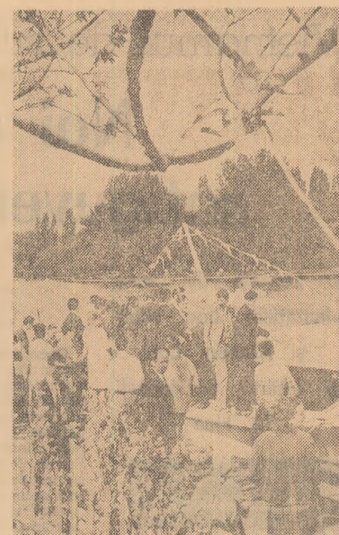
Și totuși, după atîta frig și ploaie iată o zi de vară în parcul Herăstrău

La Institutul politehnic din Galați a avut loc o sesiune tehnico-științifică a constructorilor de nave la care au participat specialiști din sanctele navale Galați, Constanța, Brăila și Oltenița, cercetători de la Institutul de calcul, Filiala Academiei Cluj, Institutul de proiectări și automatizări București, cadre didactice de la Universitatea din Iași, institutele politice Timișoara și Galați.