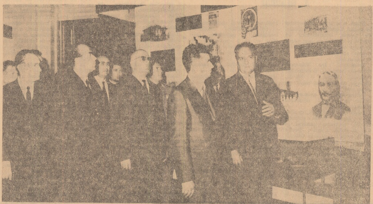
În timpul vizitei în regiunea Oltenia: la Uzinele „Electroputere” și la Liceul „Nicolae Bălcescu” din Craiova.