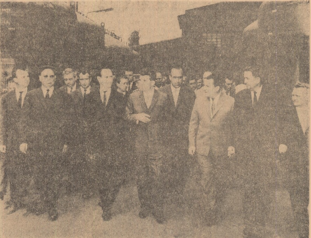
La Uzina mecanică din Turnu Severin

Tudor Vladimirescu a înțeles că numai mobilizînd poporul la luptă se putea obține eliberarea patriei noastre de jugul străin, scăpa țara de asuprirea moșierilor și asigura un viitor fericit pentru cei mulți. Sub conducerea sa, țărani au dus lupte grele și au reușit, pentru un moment, să obțină succese. Împrejurările, de neamînțămînt sînt cunoscute, nu as vrea să mă refer la ele. Dar lupta lui Tudor Vladimirescu nu a rămas fără urmări. Ceea ce a început Tudor au continuat revoluționarii democrați de la 1848, a dus mai departe, într-o formă superioară, Partidul Comunist — continuatorul celor mai bune tradiții de luptă ale poporului nostru. Poporul român a dat multe jertfe în lupta de eliberare națională și socială, pentru a ajunge să fie stăpîn pe soarta sa, făurind, în frunte cu Partidul Comunist, patria care este acum a norodului.