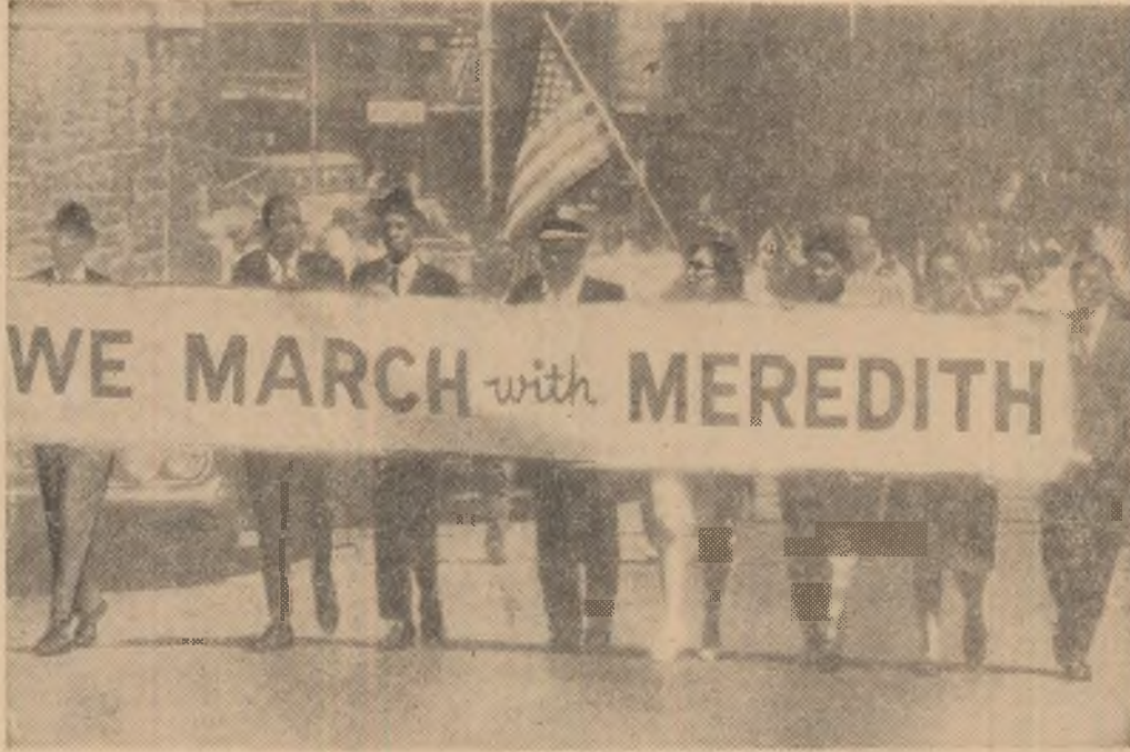
S.U.A. Populația de culoare din statul Mississippi a organizat un marș de protest în sprijinul luptei pentru drepturile cetățenilor. Pe pancarta lor s-a scris: „Sintem alături de tine Meredith”

La rândul său, ziarul „Viesnik”, care apare la Zagreb, scrie că „teatrul românesc a prezentat o pleiadă de actori excelenți pe care multe teatre, nu numai cel iugoslav, și i-ar dori”.