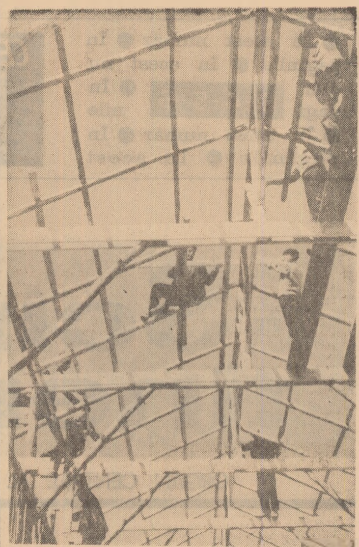
La G.A.S. Leorda, se construiesc două noi pătule pentru viltoarea reoaltă de porumb.

„Dragi tovarăși, vă rugăm să îmi trimiteți aceste rînduri în haine sărbătorești. Iți asigurăm pe tovarășii noștri profesori că ne vom strădui să fim la înălțimea grîjii și sentimentelor cu care ne-au înconjurat în toți anii școlii, comparîndu-ne în viața noastră cu ne-au învățat ei și-o facem: cîștîm, mo-