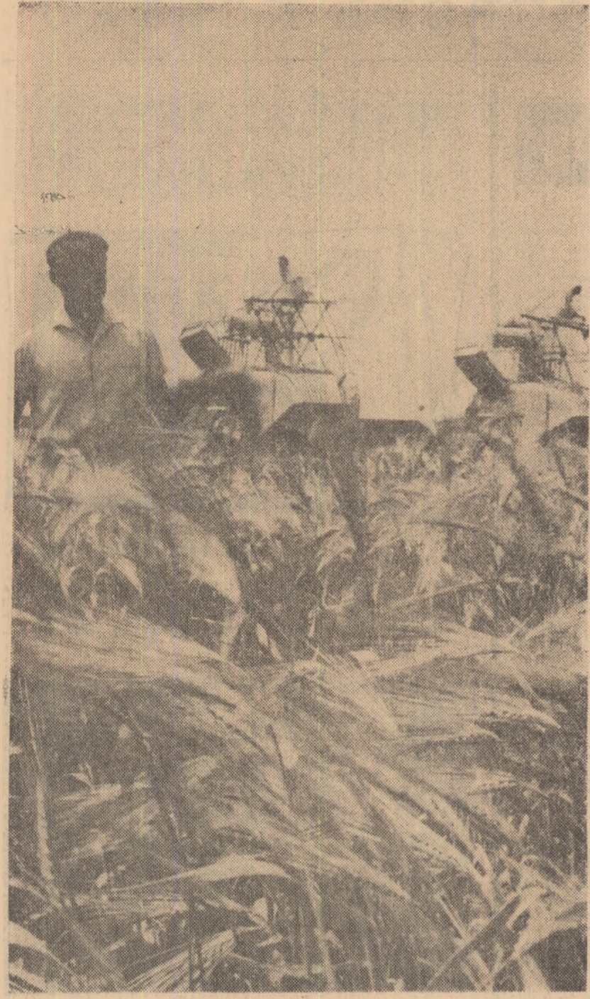
Un moment solemn: la marginea oceanului de spice, corăbiile argintii sînt gata să ridice ancora.