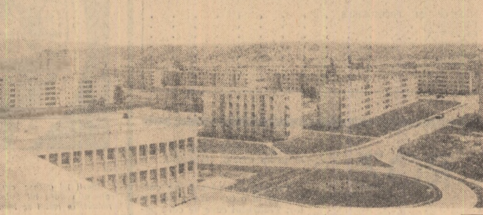
Privire asupra Orașului Gheorghe Gheorghiu-Dej

• Inima orașului • Poveste despre ritmuri • În căutarea unui „nemotivat” • Există un punct critic? • Maiștrii au cuvinte de laudă