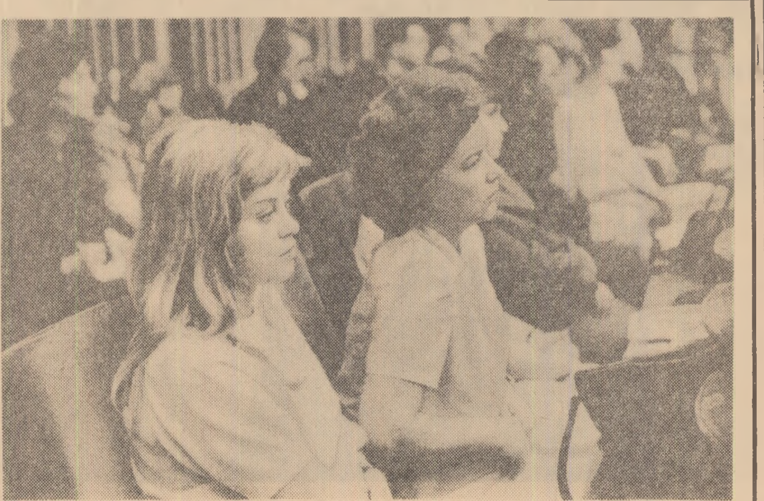
În timpul lucrărilor Conferinței

Conferința a aprobat în unanimitate următoarea ordine de zi: