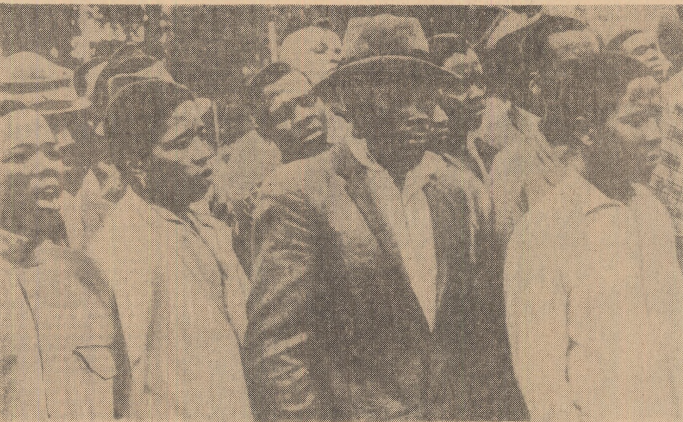
REPUBLICA SUD-APRICANĂ. — Demonstrație a populației de culoare din R.S.A. împotriva politicilor de apartheid promovate de guvernul de la Pretoria