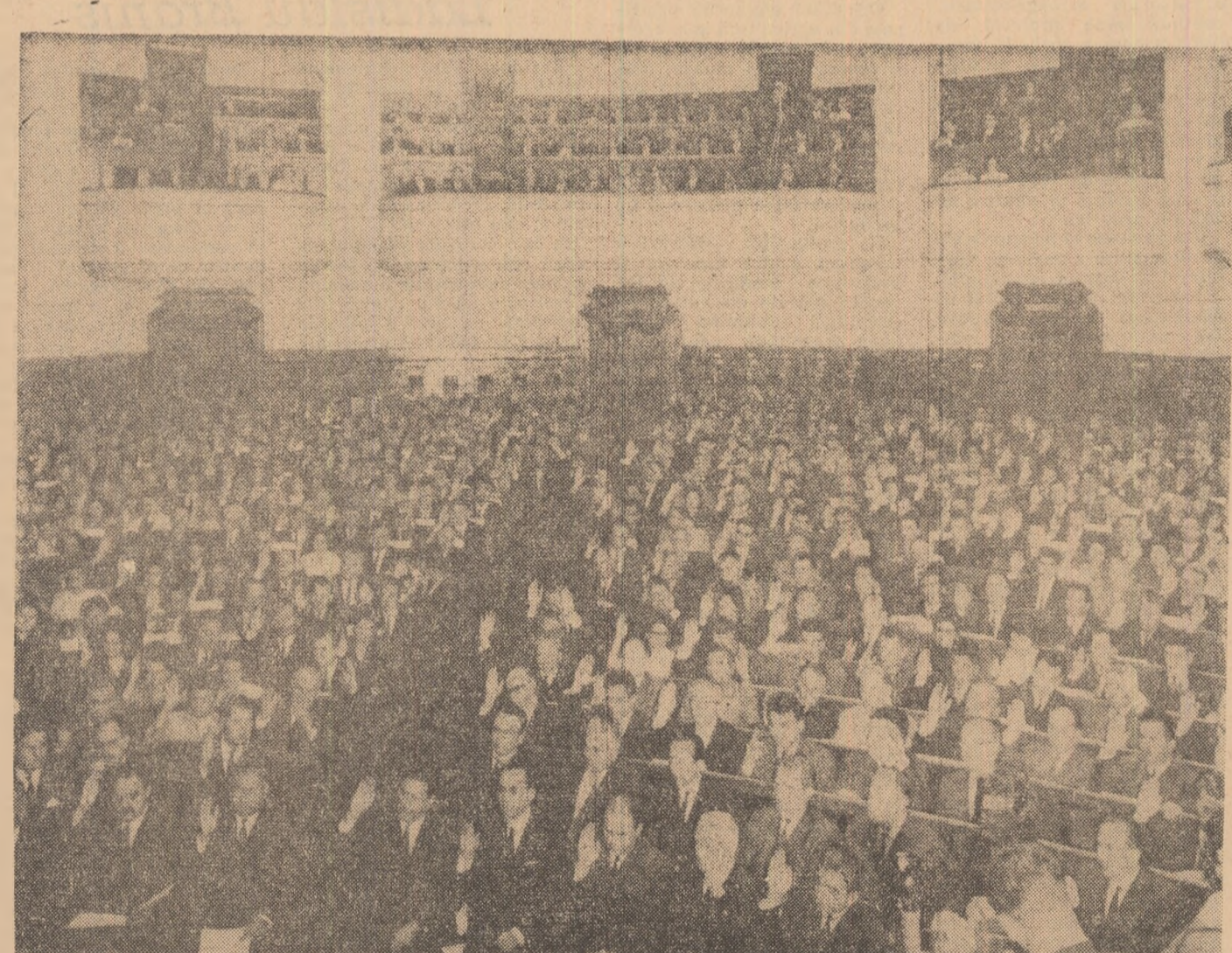
În timpul lucrărilor sesiunii Marii Adunări Naționale