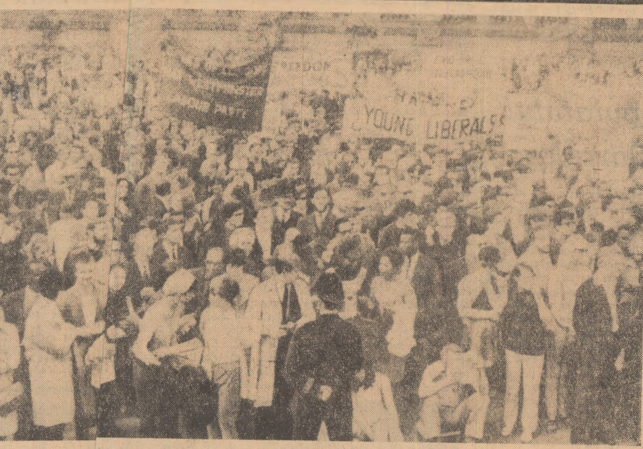
Mii de tineri sînt au luat parte la mitingul desfășurat la Trafalgar Square sub lozina „Libertate în Rhodesia”