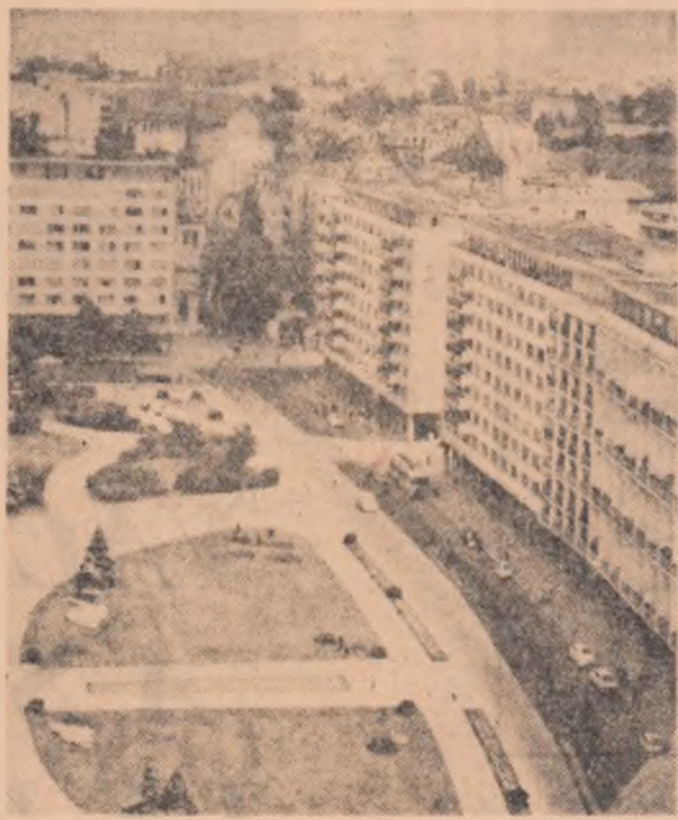
Acest complex arhitectonic cuprinde „o piesă rară” despre care atunci cînd se fac referiri numeroși specialiști cu „sonoritate” au întrebuințat numai superlativul