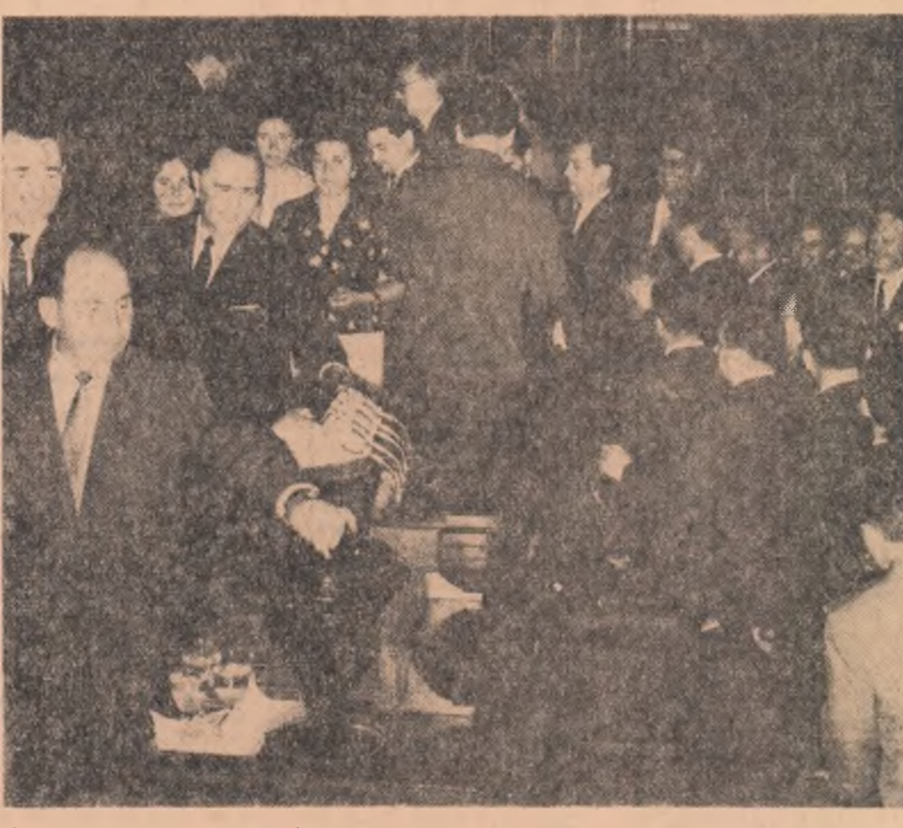
Se votează legea cu privire la înființarea, organizarea și funcționarea liceelor de specialitate

În lumina acestor considerații, Comisia pentru cultură și învățămînt și Comisia juridică avizează favorabil, în unanimitate, proiectul de lege cu privire la înființarea, organizarea și funcționarea liceelor de specialitate și propun adoptarea ei în forma în care este prezentată deputaților Mării Adunări Naționale.