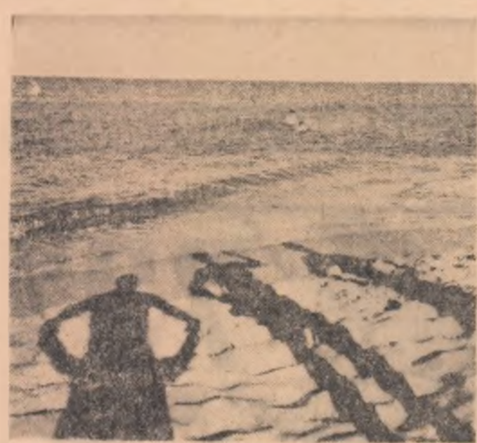
Pe litoral, la plaja