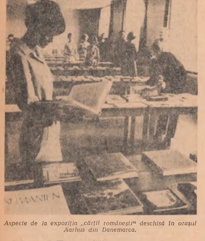
Aspecte de la expoziția „cărții românești” deschisă în orașul Aarhus din Danemarca.

Noul președinte al Argentinei, generalul Juan Onganía, a adresat joi seara națiunii primul său mesaj radiodifuzat, în care a anunțat că guvernul elaborează „un plan vast de reforme”. Observatorii din capitala argentiniană remarca faptul că deși au trecut 72 de ore de la lovitură de stat militară, noul regim nu a reușit însă să formeze un guvern. Agenciile occidentale de presă, anunță că regimul militar instalat în Argentina a început o campanie de represii împotriva elementelor democratice. Joi, poliția a efectuat percheziții la 32 de sedii ale Partidului Comunist și ale altor organizații progresiste, arestînd mai multe persoane. După cum relatează agenția France Presse, poliția a ordonat închiderea tuturor sediilor Partidului Comunist, precum și a Ligii argentinene pentru drepturile omului, Uniunii femeilor din Argentina, Consiliului păcii din Argentina și a Federației tineretului comunist din această țară. Totodată s-a anunțat arestarea fratelui fostului președinte Illia, profesorul Ricardo Illia, în locuința cărui se află în prezent președintele demis. Surse oficiale au indicat și arestarea fostului primar al orașului Buenos Aires, Francisco Rabanal.