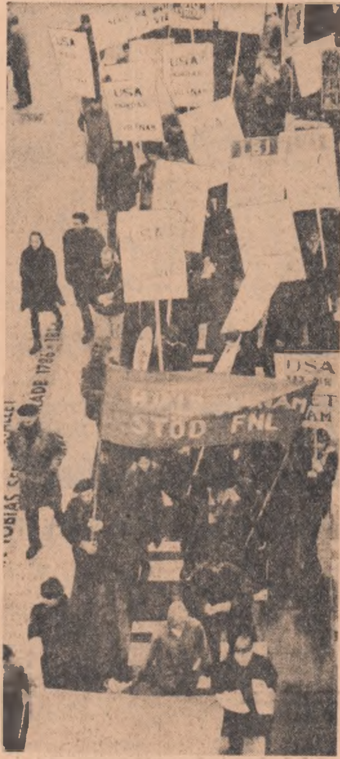
Demonstrație împotriva agresiunii S.U.A. în Vietnam, în centrul orașului Stockholm, capitala Suediei

La 1 iulie, Statele Unite au continuat să bombardeze teritoriul R. D. Vietnam, violînd spațiul aerian al provinciilor Quang Ninh și Ha Tinh. Forțele militare ale Armatei Populare vietnameze au doborît două avioane. Astfel, numărul avioanelor doborîte deasupra teritoriului R. D. Vietnam de la 5 august 1964 la 1 iulie 1966 se cifrează la 1151.