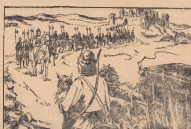
Despre legăturile de dragoste ale lui Simion cu Marușca au aflat și părinții lor. Iată că Jderii au venit într-o vizită la boier Iașco. Numai că Marușca se poartă tare copilărește, lucru care numai lui Simion îi place.

Adaptare de GHEORGHE SUCIU Desene de MARIN PREDESCU