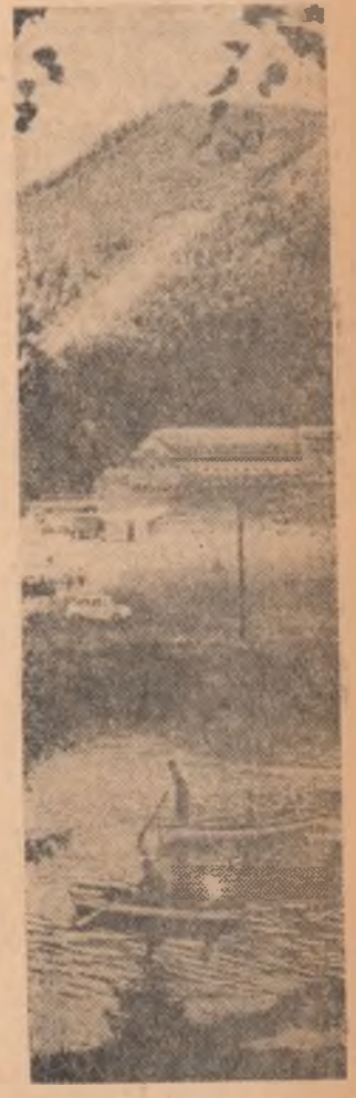
La Polana Brașov

BRIGADA „SCINTEI TINERETULUI” ● NICOLAE ARSENIU ● ARTUR IOAN ● ESTER IERAS ● VASILE RAVERSCU FOTOGRAF DE :