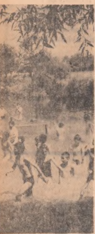
La ștrandul taberei de pionieri și școlari de la Mogoșoaia

...Dacă să vedem și cum își îndeplinește Piteștii îndatoririle de gazdă. Vizitarea celor două baze turistice școlare amenajate aici a fost în acest sens edificatoare. Curățenia ireproșabilă a dormitoarelor, prezența zilnică a unor ghizi gata oricînd să-i primească și să-i însoțească pe oaspeți, cit și organizarea unor „colțuri turistice” ce reunesc obiecte