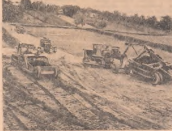
Lucrări de amenajare a unei crescătorii de pește pe terenul Gospodăriei agricole de stat — Butimannu, regiunea București