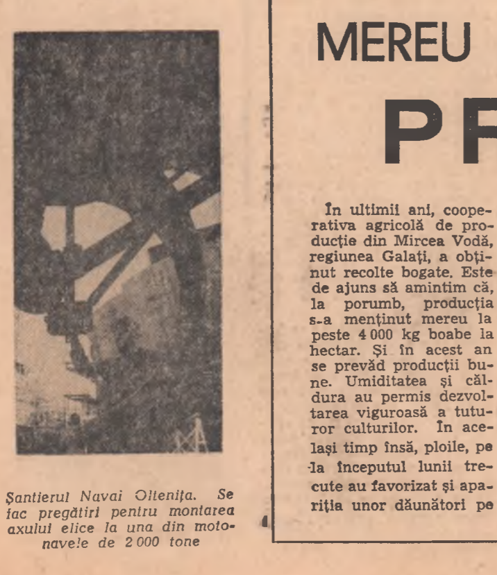
Santierul Navai Olenița. Se fac pregătiri pentru montarea axului elice la una din motonavele de 2.000 tone

plînd-o de zădri era deplin încredințat că o umple, în același timp, de istorie; legîndu-se de ea prin întemeieri durabile își sporea neclintirea apărării. Astfel gîndite, zilele seamănă; cele de atunci se întilnesc cu cele de acum în continua aspirație către construcție și împlinire. Și devenim bogăți în timp; 500 de ani, 1.000 de ani și mai mulți încă se adăpă dînd trînciție și adăcime zilei de azi pe măsură ce dorința și fapta de muncă întăresc și înfrumusețează patria pentru prezentul fierbînte și viitorul preșătit, pentru clipă și pentru secol.