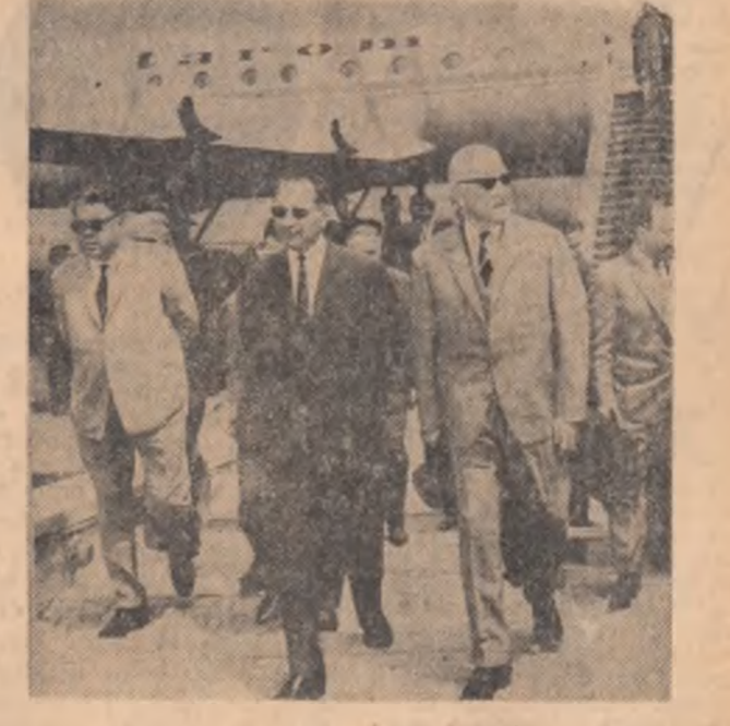
Sîmbătă la amiază s-a înapoiat în Capitală, venind din Iran, președintele Consiliului de Miniștri al Republicii So-

cialiste România, Ion Gheorghe Maurer, care a luat parte la solemnitatea înmînării însemnelor titlului de doctor honoris causa al Universității din Teheran.