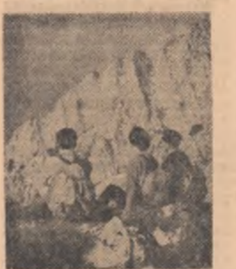
50.000 km în plus

Recent, într-o simțată, am luat cunoștință de planul comisiei de turism a Comitetului regiunii U.T.C. Timișoara. Planul, cuprînzînd traseele drumeștiilor, mijloacele de transport, programul manifestărilor culturale-artistice ce vor avea loc pe locurile de întîlnire a tinerilor este difuzat, o dată cu invitația de a participa în număr cit mai mare, tuturor organizațiilor U.T.C. Răspunsurile nu întîrzie. Le urmărim acum transpuse în imagini concrete: sute de tineri cu rucsacuri, pe biciclete, în mașini sau pe jos se îndreaptă spre barierele orașului.