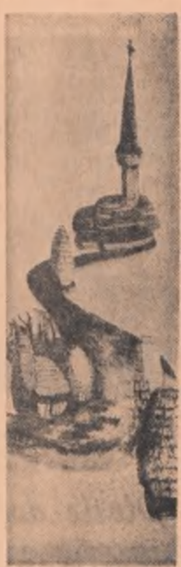
„Peisaj” I. GEORGESCU - Liceul de artă plastică București