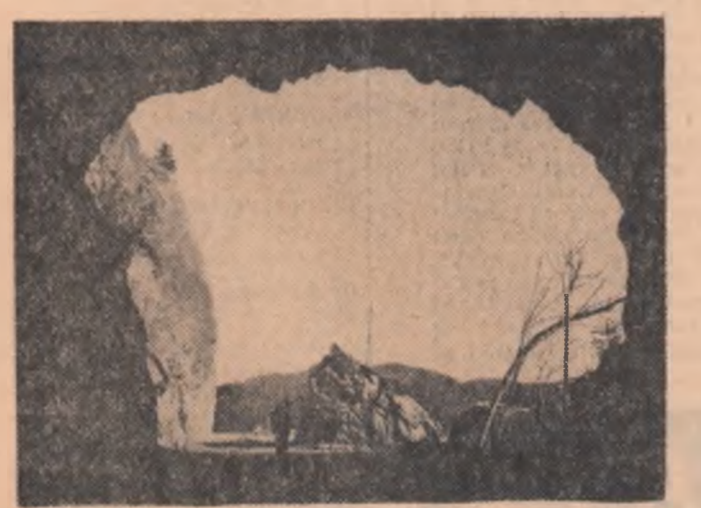
Vedere de la Argeș