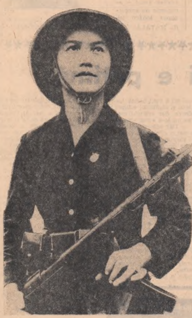
R. D. VIETNAM: O tinărbă membră a unei unități de miliție populară

În timp ce cercurile guvernamentale ale S.U.A. repetă că ar fi bombardate numai „obiective militare” subliniază memorandumul aviația americană bombardează zone cu o populație densă, cu scopul de a distruge instituțiile de