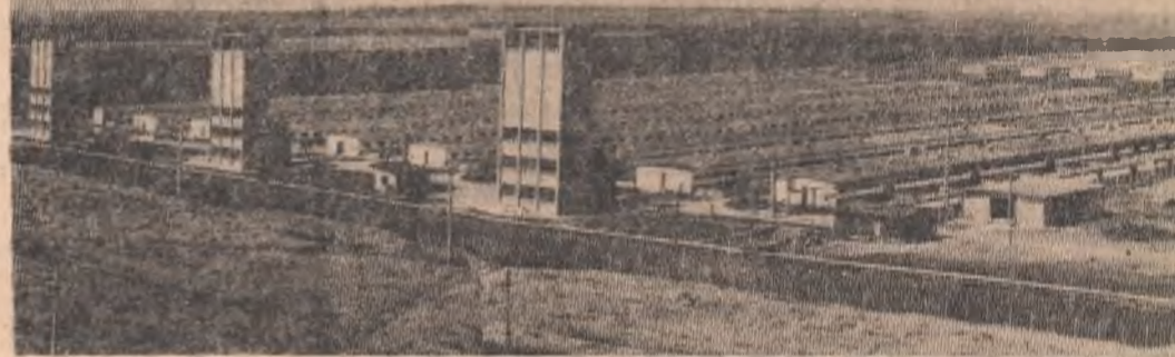
Căzânești: vedere generală a combinatului de creștere și îngrijire a porcilor