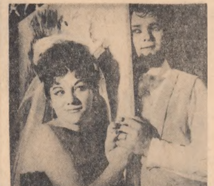
Scenă dintr-o recentă premieră a Teatrului muzical din Galați

De la orele 2 în Capitală nu mai există nici un local deschis. Singurele cu program prelungit, barurile „Melody” și „Continental” își suspendă activitatea pe timpul verii. Oricît ar părea de ciudat pentru unii, este nefiresc ca în Capitală să nu existe un local unde să poți fi primit la orice oră. Cerințele unui oras mare, modern, cu o populație numeroasă, implică necesitatea unor asemenea localuri în perioada verii s-ar putea recomanda unor grădini regim de bar, în ceea ce privește cel puțin timpul de funcționare; chiar dacă nu ar avea programe stupide și vulgare, de genul celui infitului „Sfîntul la Continental” din defuncta stațiune a localului citat.