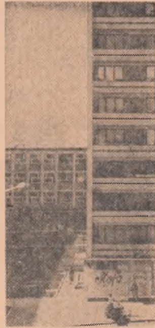
Cadru arhitectonic brăilean