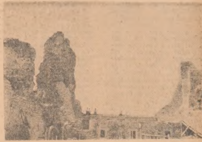
La ruinele Cetății Neamțului au început lucrările de restaurare

ION MARCOVICI (Continuare în pag. a III-a)