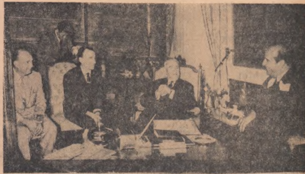
In timpul convorbirilor româno-turce